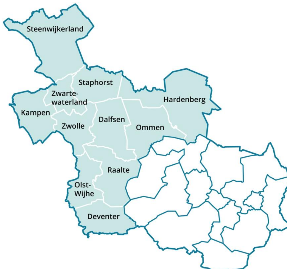
Figuur 2.1 Deelnemende gemeenten in de RES-regio West-Overijssel

Het plangebied betreft het gehele grondgebied van het samenwerkingsverband West-Overijssel. Dit zijn de gemeenten: Dalfsen, Deventer, Hardenberg, Kampen, Olst-Wijhe, Ommen, Raalte, Staphorst, Steenwijkerland, Zwartewaterland en Zwolle.