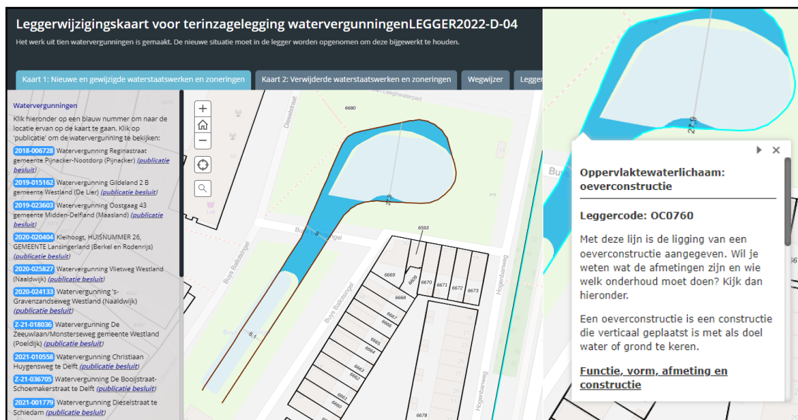
Figuur 1: Voorbeeld weergave van de interactieve leggerwijzigingskaart

Een voorbeeld van de werking van de leggerwijzigingskaart is weergegeven in Figuur 1.