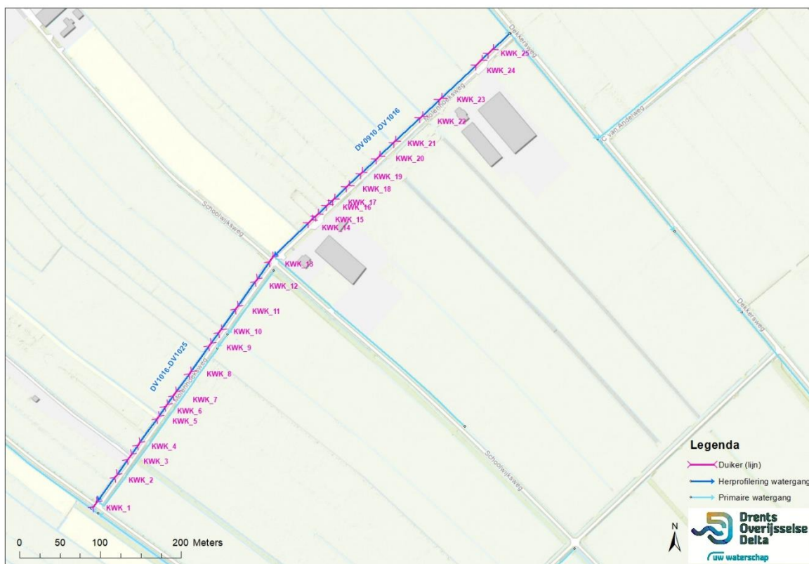
Figuur 1.1 Waterhuishoudkundige knelpunten aan de Molenhoeksweg in Staphorst

Als gevolg van statuswijzigingen van watergangen is gekeken of de inrichting moet worden aangepast om het onderhoud over te kunnen dragen aan de nieuwe onderhoudsplichtige. Maatregelen die nodig zijn om de onderhoudsinrichting aan te passen noemen we waterschapszorg maatregelen . Alle maatregelen die leiden tot een wijziging van een waterstaatswerk zijn opgenomen in projectplan met zaaknummer Z/22/047422. In dit projectplan worden extra werkzaamheden beschreven aan de Molenhoeksweg in Staphorst (zie figuur 1). Dit zijn zogenaamde waterhuishoudkundige knelpunten, knelpunten die door beheer en onderhoud worden aangedragen. Deze worden aangepakt om de waterhuishoudkundige situatie te verbeteren en voor de toekomst geschikt te maken. In bijlage 1.1 van dit rapport is als bijlage een kaart opgenomen met daarop de werkzaamheden.