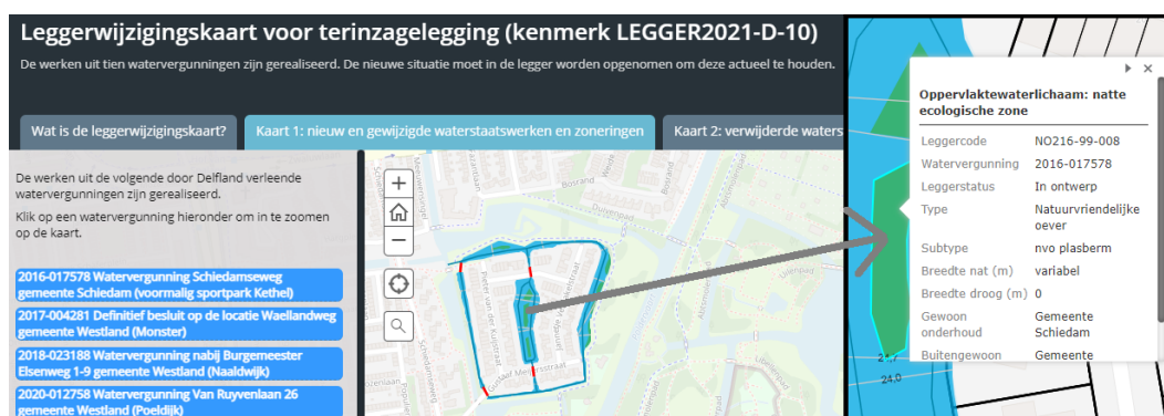
Figuur 1: Voorbeeld weergave van de interactieve leggerwijzigingskaart

Door op een waterstaatswerk op de kaart te klikken, opent er een pop-up scherm. Hierin staan de specifieke gegevens van dat waterstaatswerk, zoals de afmetingen of op wie de onderhoudsplicht rust. Ook kan, indien van toepassing, de bijlage met het leggerprofiel worden geopend. Een voorbeeld van de werking van de leggerwijzigingskaart is weergegeven in Figuur 1.