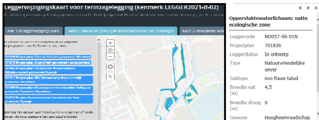
Figuur 1: Voorbeeld weergave van de interactieve leggerwijzigingskaart

Door op een waterstaatswerk op de kaart te klikken, opent er een pop-up scherm. Hierin staan de specifieke gegevens van dat waterstaatswerk, zoals de afmetingen of op wie de onderhoudsplicht rust. Ook kan, indien van toepassing, de bijlage met het leggerprofiel worden geopend. Een voorbeeld van de werking van de leggerwijzigingskaart is weergegeven in Figuur 1.