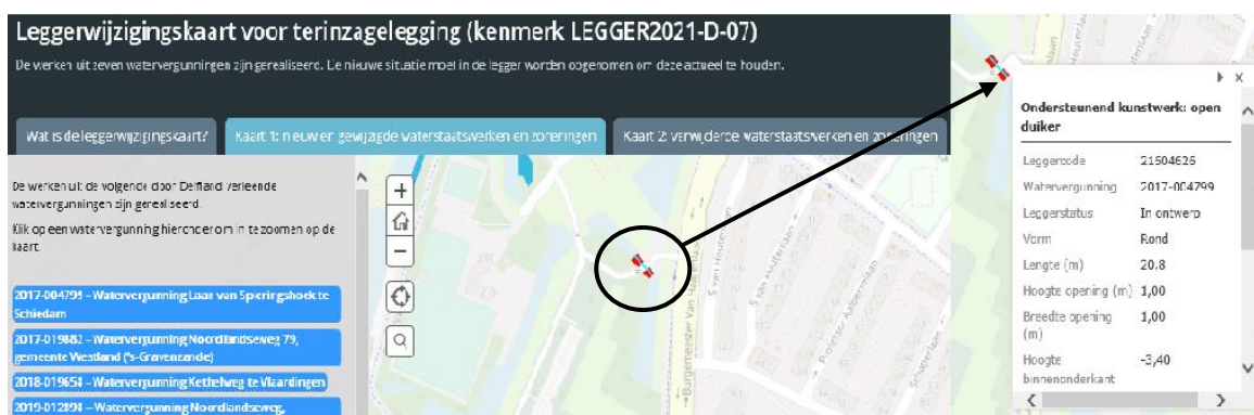
Figuur 1: Voorbeeld weergave interactieve leggerwijzigingskaart LEGER2021-D-04

Door op een waterstaatswerk op de kaart te klikken, opent er een pop-up scherm. Hierin staan de specifieke gegevens van dat waterstaatswerk, zoals de afmetingen of op wie de onderhoudsplicht rust. Ook kan, indien van toepassing, de bijlage met het leggerprofiel worden geopend. Een voorbeeld van de werking van de leggerwijzigingskaart is weergegeven in Figuur 1.