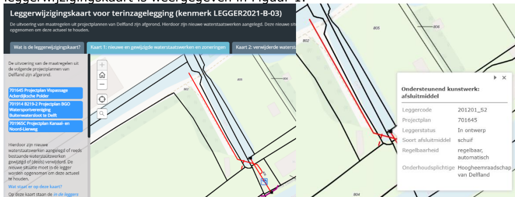
Figuur 1: Voorbeeld weergave van de interactieve leggerwijzigingskaart

Door op een waterstaatswerk op de kaart te klikken, opent er een pop-up scherm. Hierin staan de specifieke gegevens van dat waterstaatswerk, zoals de afmetingen of op wie de onderhoudsplicht rust. Ook kan, indien van toepassing, de bijlage met het leggerprofiel worden geopend. Een voorbeeld van de werking van de leggerwijzigingskaart is weergegeven in Figuur 1.