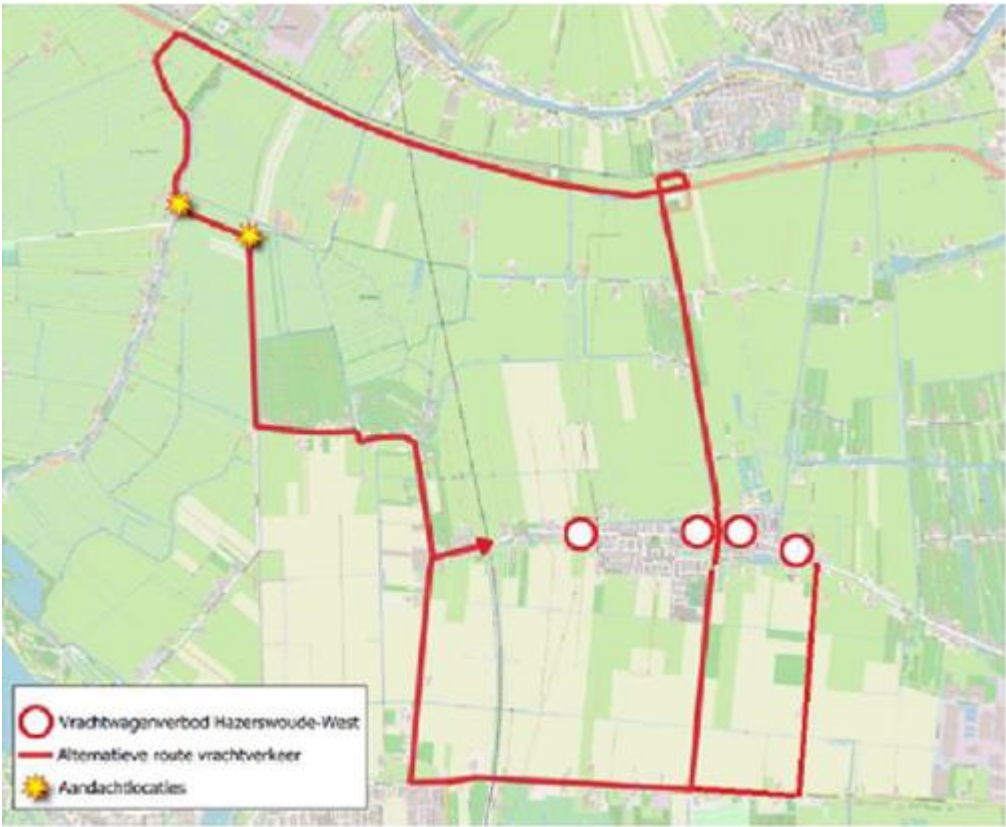
Afbeelding 2: Alternatieve route vrachtverkeer