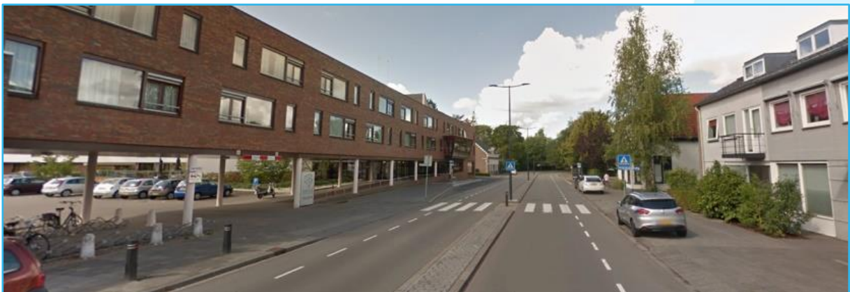
Afbeelding 3: Overzichtsfoto De Breedonk.

Ter hoogte van De Breedonk ligt een voetgangersoversteekplaats, in de vorm van een zebraapad. Voetgangers kunnen hier gefaseerd oversteken door de aanwezigheid van een middenberm.