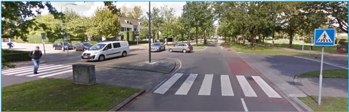
Afbeelding 2: Overzichtsfoto kruispunt Chopinstraat.

Ter hoogte van de Chopinstraat ligt een voetgangersoversteekplaats in de vorm van een zebraapad. Voetgangers kunnen hier gefaseerd oversteken door de aanwezigheid van een middenberm.