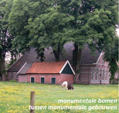
monumentale bomen tussen monumentale gebouwen