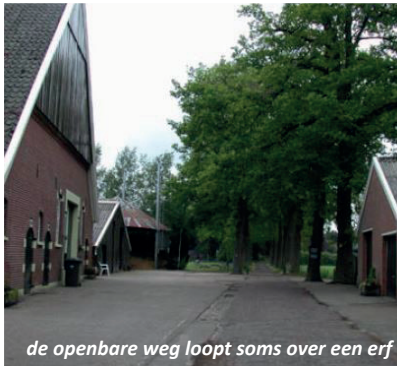
de openbare weg loopt soms over een erf