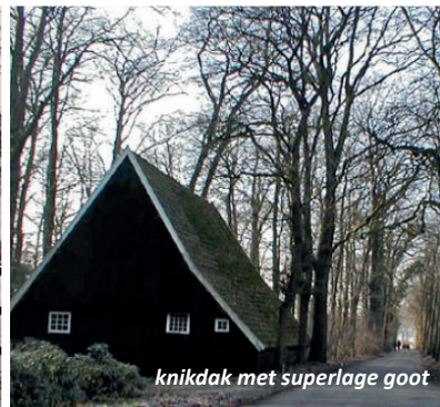
knikdak met superlage goot