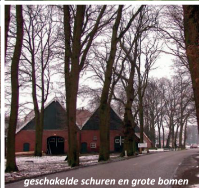
geschakelde schuren en grote bomen