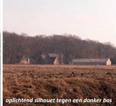
oplichtend silhouet tegen een donker bos