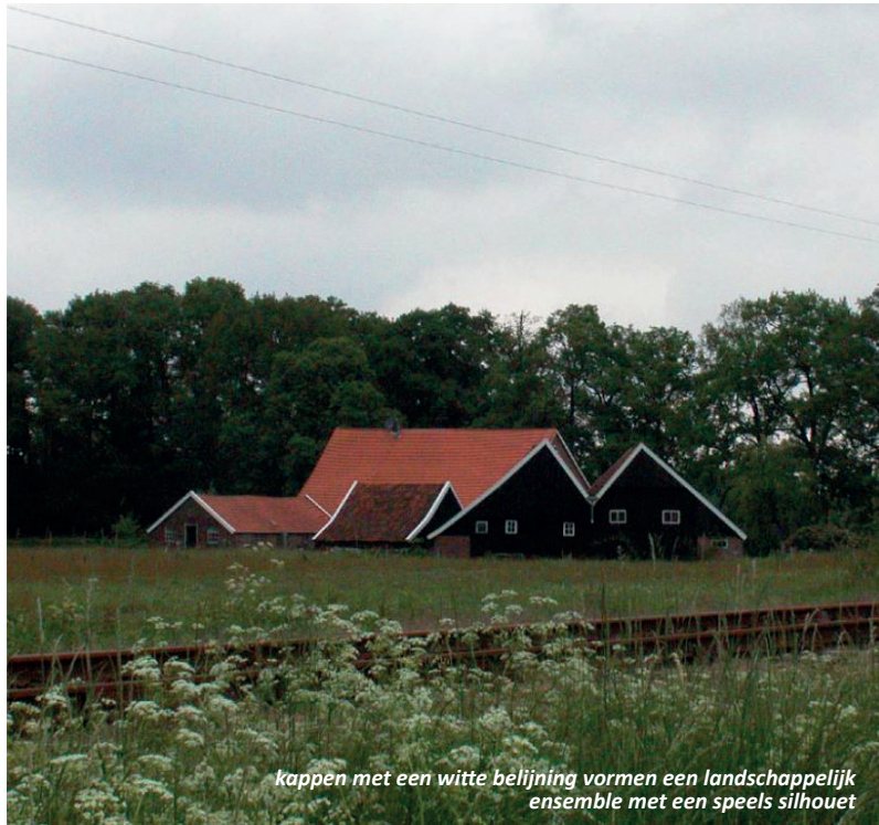
kappen met een witte belijning vormen een landschappelijk ensemble met een speels silhouet