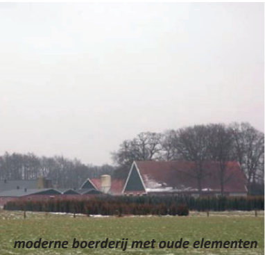
moderne boerderij met oude elementen