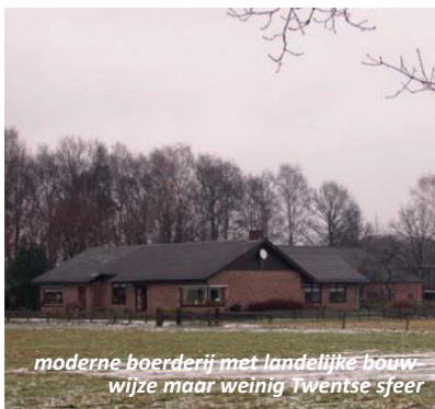
moderne boerderij met landelijke bouw- wijze maar weinig Twentse sfeer