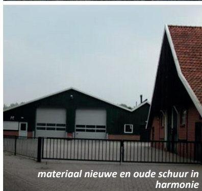
materiaal nieuwe en oude schuur in harmonie