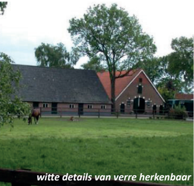
witte details van verre herkenbaar