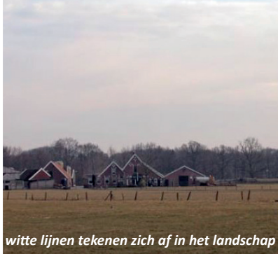
witte lijnen tekenen zich af in het landschap