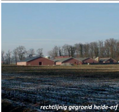
rechtlijnig gegroeid heide-erf