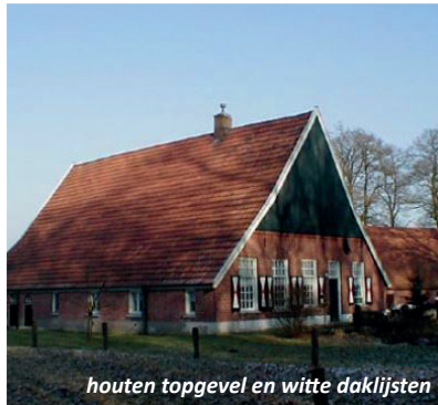
houten topgevel en witte daklijsten