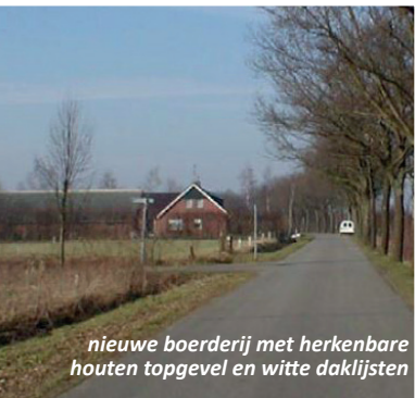
nieuwe boerderij met herkenbare houten topgevel en witte daklijsten