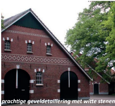
prachtige geveldetaillering met witte stenen