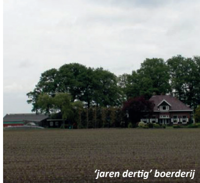
'jaren dertig' boerderij