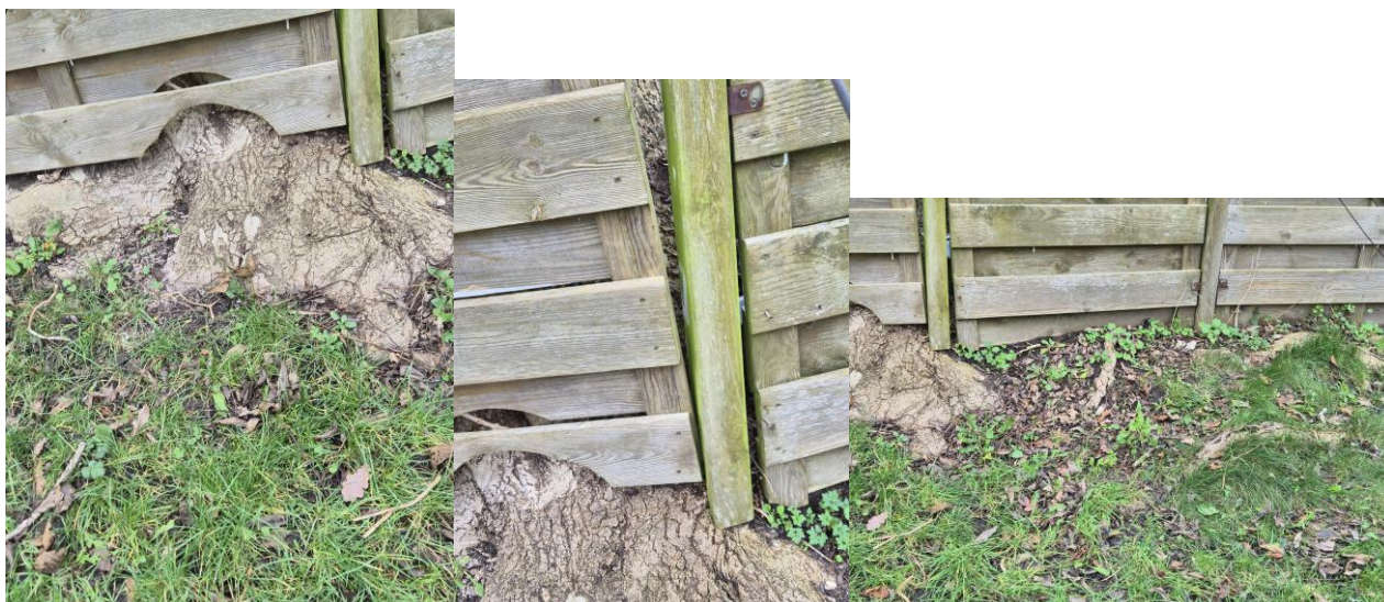
Boomwortels in de tuin van de buren, waardoor kapotte schutting (foto 1,2,3)