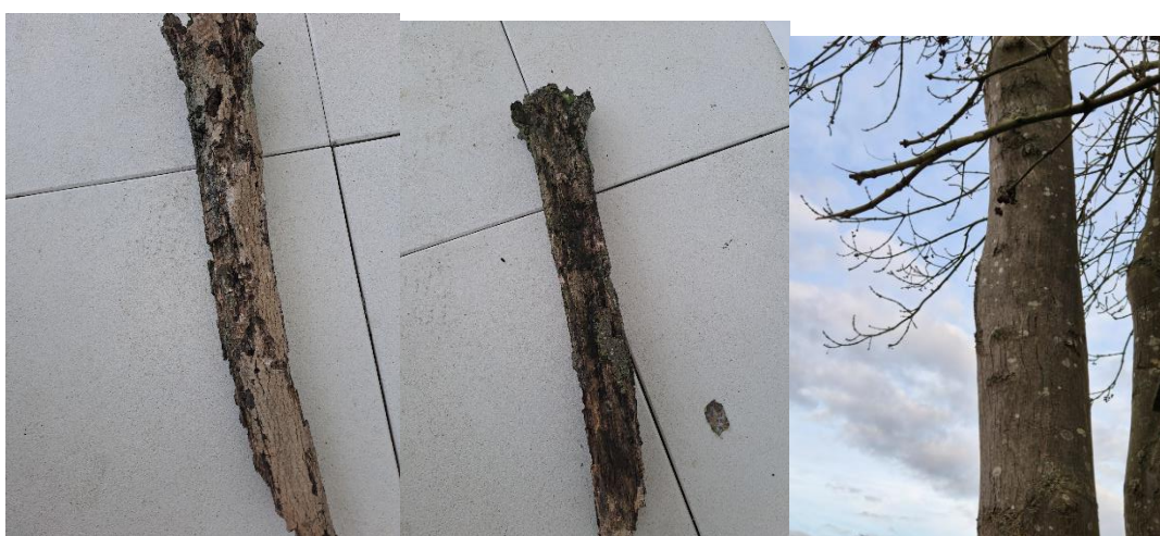
Hierboven takken en gedeelten van takken die er steeds afvallen en dode takken in boom (foto 4,5,6)