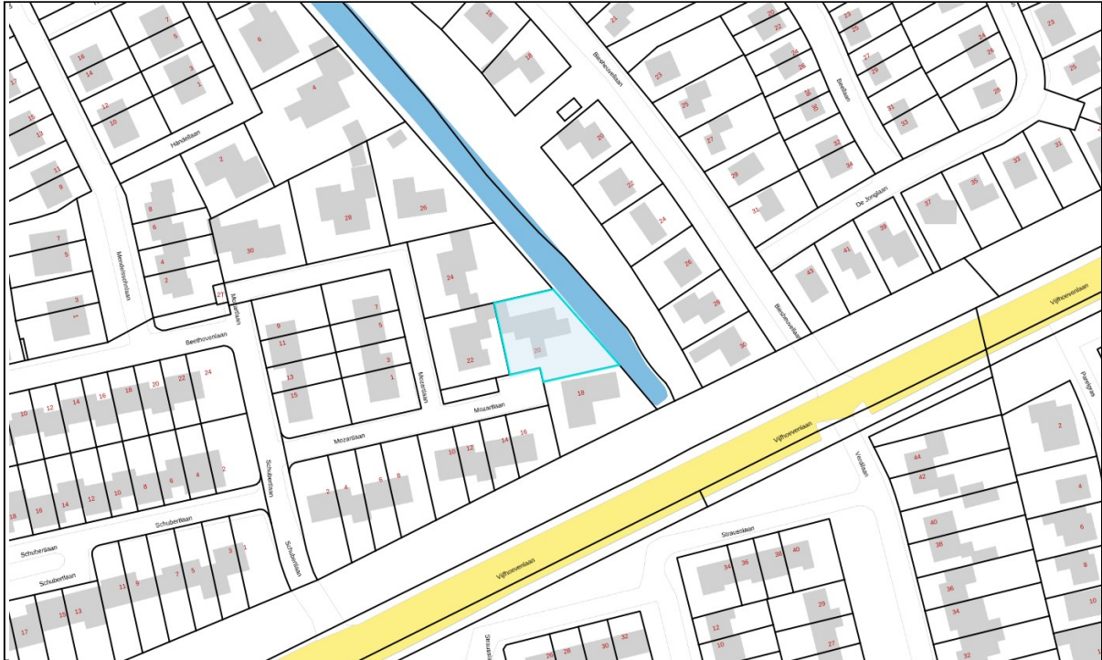
FIGUUR A: SITUATIE TEKENING LOCATIE PERCEEL IN WOONWIJK

Het perceel te Mozartlaan 20 te Vlijmen is circa 780 m 2 groot. De bebouwing op het perceel betreft een bungalow. De vergunning heeft betrekking op het kappen van een tweetal bomen. Dit in het kader om toekomstige schade te voorkomen aan de omheining van het perceel en eventuele schade of ongelukken in het achtergelegen parkje, langs de sloot. Dit in geval van een potentiële storm, waarbij de bomen het zouden begeven.