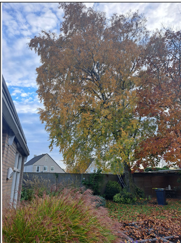
FIGUUR D: RUWE BERK: BETULA PENDULA