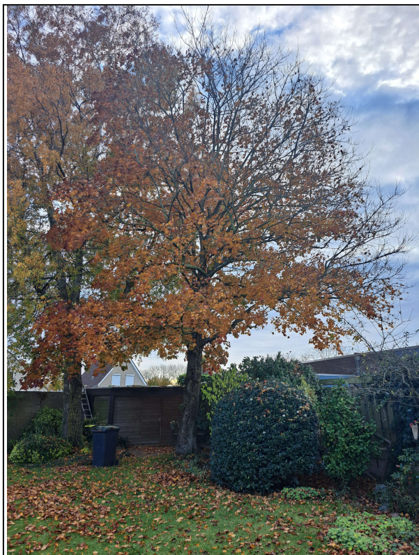
FIGUUR C: ESDOORN: ACER PSEUDOPLATANUS