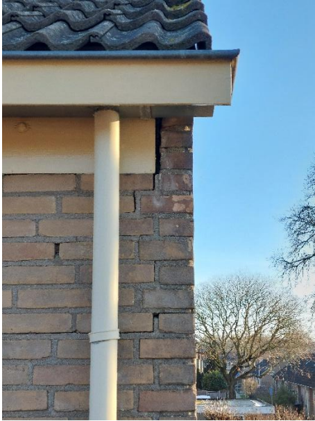
Afbeelding 2. Openingen aan weerszijden van plank.

Woonblokken 117 – 131 hebben als afwerking van de dakrand een bredere houten plank. Er zijn aan de voorzijde van 131-143 openingen zichtbaar (afbeelding 2 en 3). Deze zijn geïnspecteerd op nestmateriaal. Dit was niet aanwezig. Ook bleken hier op hoeken van de kopgevels wat poreuze delen (afbeelding 4). Maar wederom geen nestmateriaal. Over de rest van de rand tussen spouwmuur en dak zijn er geen potentiële nestlocaties aangetroffen.