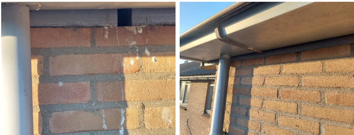
Afbeelding 1. Gierzwaluwnest (links) en dichte spouwmuurrand (rechts).

In het woonblok 134-144 zijn twee openingen zichtbaar. Hier zijn ontlasting sporen zichtbaar. Deze openingen zijn in gebruik door gierzwaluw. Over de rest van de breedte voor- en achterzijde zijn er geen openingen waargenomen. Ook de kopgevelranden zijn bekeken. Hier is achter de boeiboord wel ruimte aanwezig, maar geen nesten van huismussen.