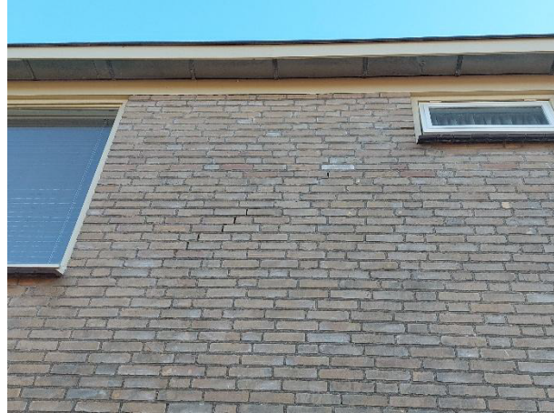
Afbeelding 3. Verder geen openingen.