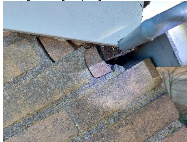
Afbeelding 4. Geïnspecteerde plekken met poreus materiaal op kopgevels woonblokken 117 – 131.

Op nummer 127 was er een ijverig mannetje aan het zingen. Er is voldoende reden aan te nemen dat het nest zich bevindt onder de dakpannen. Er zijn geen overige geschikte nestplekken waargenomen.