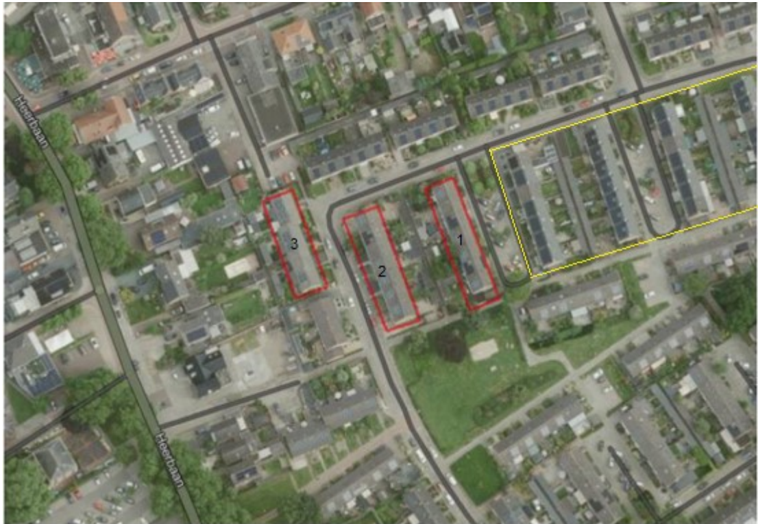
Figuur 1. Luchtfoto van het plangebied (rood). De blokken met de tijdelijke voorzieningen (geel).