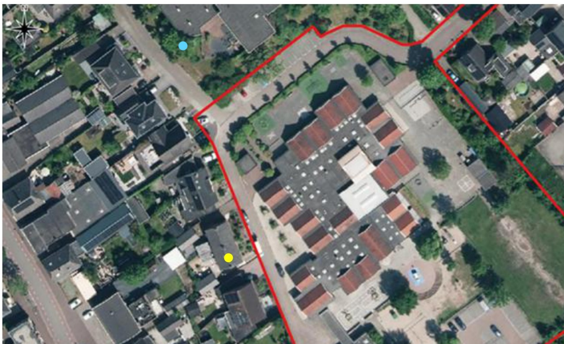
Figuur 12. Nestindicerende waarnemingen van de huismus (gele stip) en losse waarneming van de soort (blauwe stip) in de omgeving van het projectgebied (rood kader).

De eerste huismusronde is uitgevoerd in de middag van 10 april 2025. Hierbij is de bebouwing binnen het projectgebied evenals de omliggende woningen onderzocht op de aanwezigheid van huismussen. In de begroeiing aan de achterkant van het Almende College werd wel kort één zingend huismusmannetje gezien. Ook op het dak van Pastoor Bluemersplein 7 was één zingend huismusmannetje voor langere tijd ter plaatse (Figuur 12). Op of rondom de bebouwing binnen het projectgebied werden echter geen huismussen waargenomen.