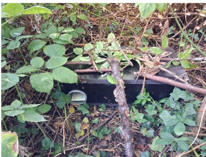
Figuur 3. De marterbox in de zuidelijke hoek van het projectgebied.

Met betrekking tot de tweede helft van het onderzoek is overleg gevoerd met de provincie Gelderland (referentienummer 251002-000062).