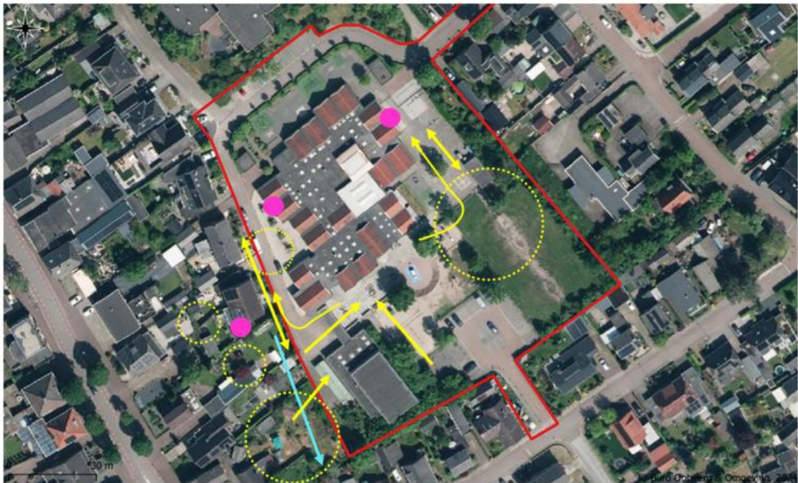
Figuur 6. Waarnemingen van foerageergedrag (gestippelde cirkels), vliegbewegingen (pijlen) en zomerverblijven (roze stippen) van de gewone dwergvleermuis (geel) en rosse vleermuis (lichtblauw).

Het derde vleermuisonderzoek vond plaats in de vroege ochtend van 23 juli 2025. Om 02:57 werd een gewone dwergvleermuis vastgesteld ter hoogte van de noordwestkant van het schoolgebouw. Deze soort werd gedurende het gehele onderzoek waargenomen. De gewone dwergvleermuis foerageerde voornamelijk boven het zuidoostelijke grasveld binnen het projectgebied. Om 05:31 is een invliegend exemplaar van de gewone dwergvleermuis vastgesteld, welke achter een vergaarbak van een regenpijp aan de noordwestkant van het schoolgebouw invloog. Om 05:36 werd op eenzelfde type plek een invliegend exemplaar van de gewone dwergvleermuis waargenomen aan de noordoostkant van het schoolgebouw (Figuur 7). Daarnaast is er een invliegende gewone dwergvleermuis geconstateerd buiten het projectgebied, namelijk onder kantpannen van Pastoor Bluemersplein 9. Los van de gewone dwergvleermuis zijn er ook waarnemingen van de rosse vleermuis gedaan, met om 05:00 tevens een zichtwaarneming van de soort. Dit exemplaar vloog langs de westkant van het projectgebied in zuidelijke richting (Figuur 6). Van de rosse vleermuis zijn echter geen verblijfplaatsen te verwachten of vastgesteld tijdens deze onderzoeksronde in het projectgebied. De meervleermuis werd in het geheel niet aangetroffen.