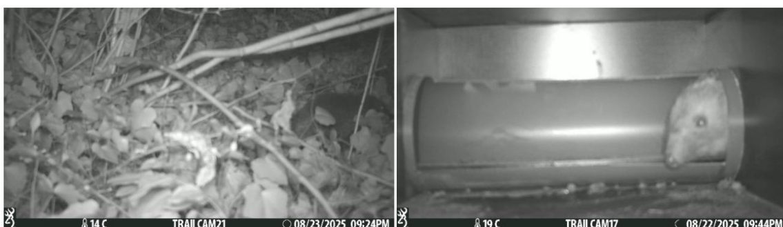
Figuur 14. Waarnemingen van de egel op de vrijstaande cameraval (links) en in de marterbox (rechts).

Tijdens het onderzoek met cameravallen is ook de egel vastgesteld in het projectgebied, in zowel de zuidwestelijke hoek als langs de oostelijke grens van het projectgebied (Figuur 14). Het is niet uit te sluiten dat de egel (nog) in het projectgebied aanwezig is tijdens de werkzaamheden. Voor de egel dient daarom de specifieke zorgplicht te worden nageleefd, waarbij passende preventieve maatregelen moeten worden genomen om nadelige effecten te beperken. Het is daarom noodzakelijk om werkzaamheden waarbij de egel verstoord kan worden, buiten de kwetsbare periodes (het voortplantings- en winterslaapseizoen) uit te voeren of op te starten, namelijk tussen 1 september en 31 oktober. Onder de versturende werkzaamheden valt in elk geval het verwijderen van groenvoorzieningen. Om invulling te geven aan de specifieke zorgplicht dient tevens een visuele check te worden uitgevoerd, alvorens wordt gestart met het verwijderen van groenvoorzieningen.