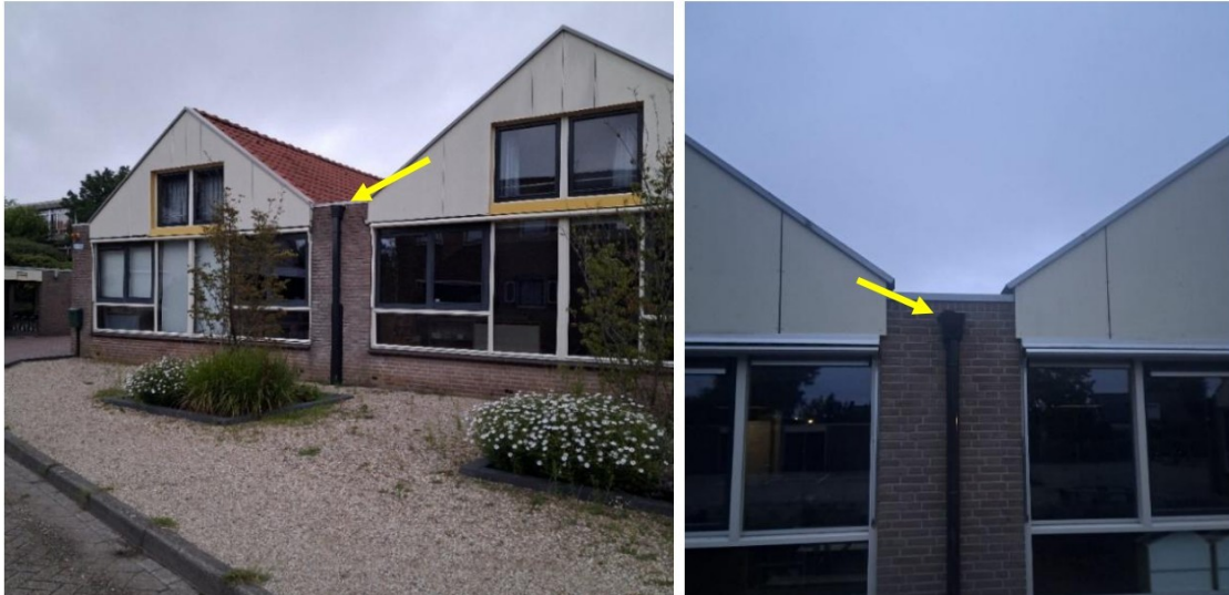
Figuur 7. Locatie zomerverblijven (gele pijlen) van de gewone dwergvleermuis aan de noordwestkant (links) en de noordoostkant (rechts) van het schoolgebouw aangetroffen op 23 juli 2025.