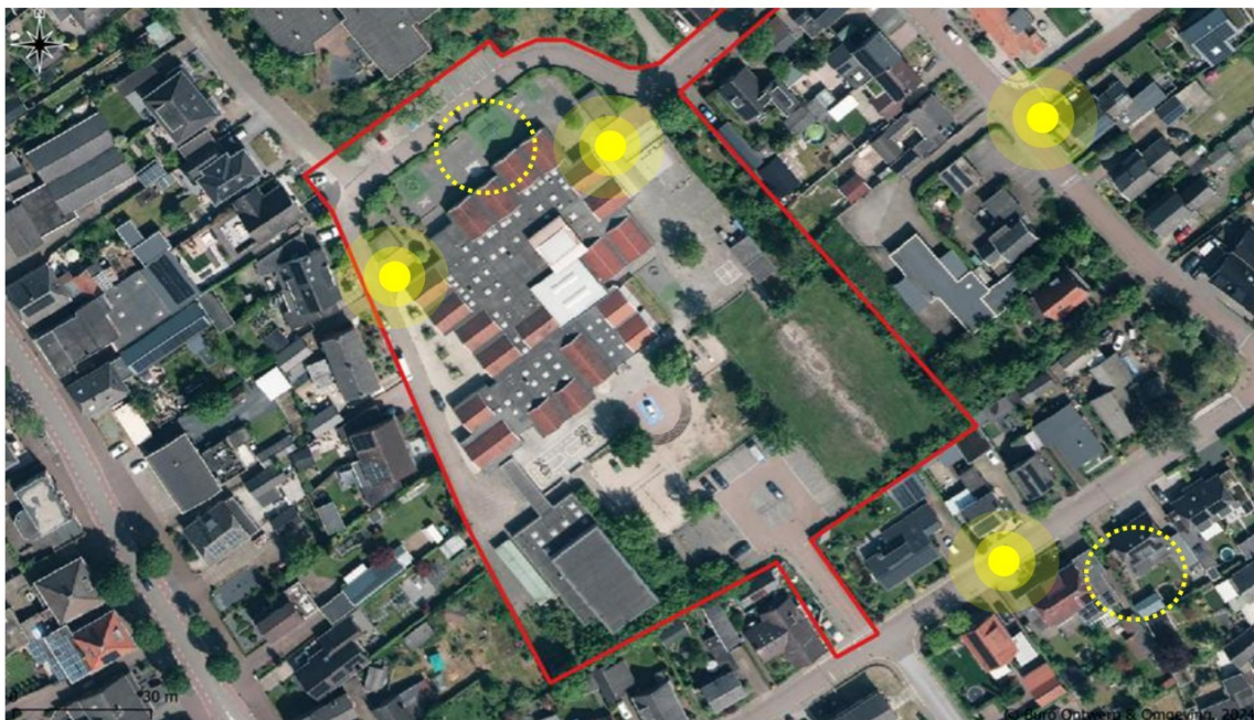
Figuur 9. Waarnemingen van foerageergedrag (gestippelde cirkels), en baltsgedrag (gebufferde cirkel) van de gewone dwergvleermuis (geel).

Het vijfde vleermuisonderzoek vond plaats in de nacht van 9 september 2025. Tijdens het onderzoek werd de gewone dwergvleermuis waargenomen in en nabij het projectgebied. In de omgeving werden in totaal vier baltterritoria van de soort vastgesteld, waarvan er twee aanwezig waren binnen het projectgebied. De twee baltterritoria binnen het projectgebied concentreerden zich rond dezelfde locaties waar op 23 juli in de vroege ochtend twee zomerverblijven van de gewone dwergvleermuis waren vastgesteld. De territoria binnen het projectgebied bevinden zich aan de noordoostelijke en noordwestelijke zijden van het schoolgebouw. Naast deze twee territoria werd één baltterritoria vastgesteld op de kruising van de Koningin Julianastraat met de Lichtenbergseweg en één op de Boterweg ter hoogte van huisnummer 21 (Figuur 9). Er werd wederom geen zwermgedrag van de gewone dwergvleermuis vastgesteld.