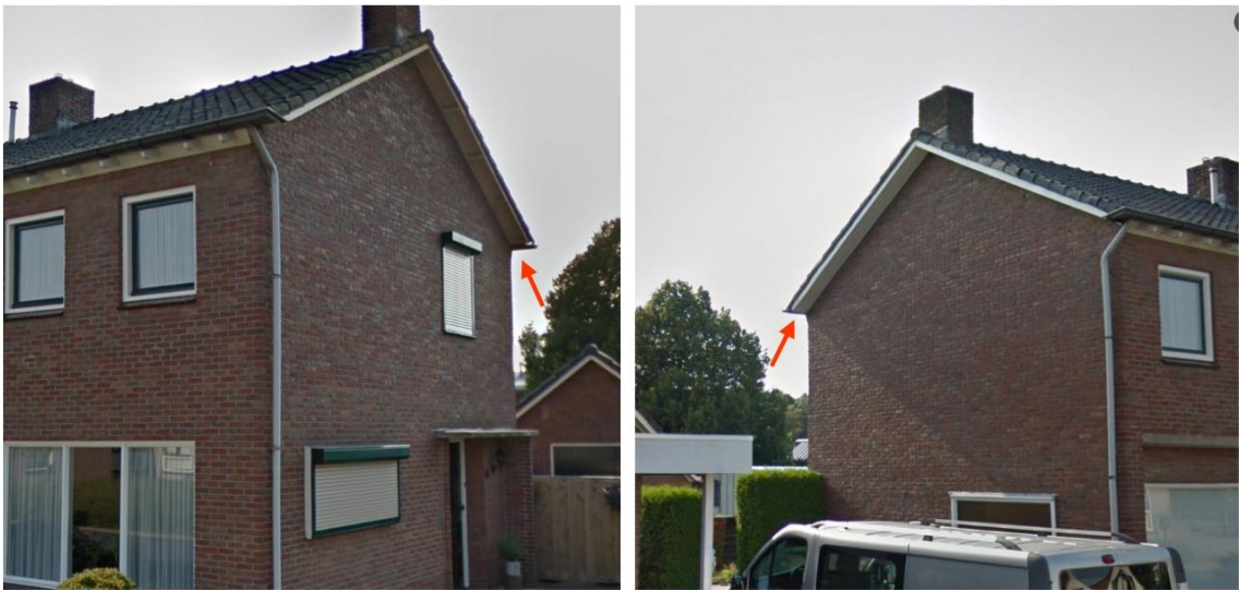
Figuur 11. Plekken waar nestlocaties van de gierzwaluw werden aangetroffen (pijlen) op Pastoor Bluemersplein 6 (links) en Pastoor Bluemersplein 7 (rechts).