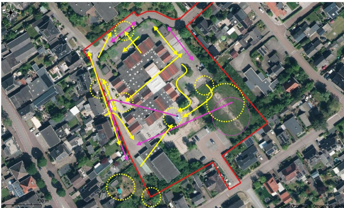
Figuur 4. Foeragegedrag (gestippelde cirkels) en waargenomen vliegbewegingen (pijlen) van de gewone dwergvleermuis (geel) en laatvlieger (paars).

Het eerste vleermuisonderzoek vond plaats in de avond en nacht van 18 op 19 juni 2025. De eerste waarneming werd gedaan om 22:12. Dit betrof een gewone dwergvleermuis die vanuit zuidwestelijke richting het projectgebied invloog tussen het schoolgebouw en de sporthal. Hierna werd de gewone dwergvleermuis regelmatig vastgesteld vanaf alle observatiepunten in het projectgebied. Naast de gewone dwergvleermuis was de laatvlieger binnen het projectgebied aanwezig. De eerste waarneming van deze soort vond plaats ten noorden van het schoolgebouw om 22:41. Hierna werd de laatvlieger vanaf alle observatiepunten passerend waargenomen. Boven het grasveld in de zuidoostelijke hoek van het projectgebied was de soort voor langere tijd foeragerend aanwezig (Figuur 4). Naast de gewone dwergvleermuis en de laatvlieger werd tevens de rosse vleermuis geconstateerd. De waargenomen vleermuizen toonden geen binding met de onderzochte bebouwing.