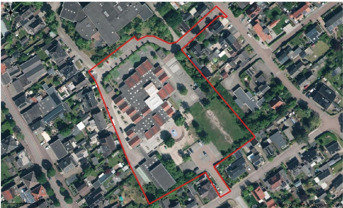
Figuur 1. Luchtfoto van het projectgebied aan het Pastoor Bluemersplein 5 te Silvolde (rood kader).

Het projectgebied bevindt zich ten zuidoosten van de bebouwde kom van Silvolde en is gelegen aan het Pastoor Bluemersplein. Op de locatie bevindt zich basisschool De Plakkenberg met bijbehorende buitenruimten en een gymzaal. In de directe omgeving van het projectgebied bevinden zich woningen en het Almende College. Op de navolgende afbeelding is de begrenzing van het projectgebied weergegeven (Figuur 1).