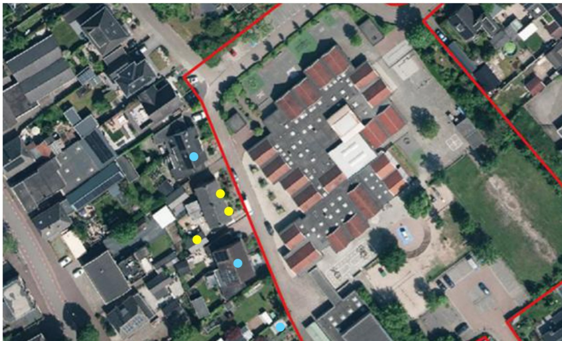
Figuur 13. Nestindicatieve waarnemingen van de huismus (gele stippen) en losse waarnemingen van de soort (lichtblauwe stippen) in de omgeving van het projectgebied (rood kader).

Het tweede huismusonderzoek vond plaats in de middag van 30 april 2025. Tijdens het onderzoek werden alleen huismussen waargenomen buiten het projectgebied. Het betrof diverse losse waarnemingen op het Pastoor Bluemersplein en drie locaties waar nest-indicerende waarnemingen werden gedaan. Onder de voorste rij dakpannen van Pastoor Bluemersplein 7 werden hier op twee plekken invliegende huismussen aangetroffen. Ook werd één zingend mannetje waargenomen op het dak van de schuur achter Pastoor Bluemersplein 7 (Figuur 13). Binnen het projectgebied werden wederom geen waarnemingen van huismussen gedaan.