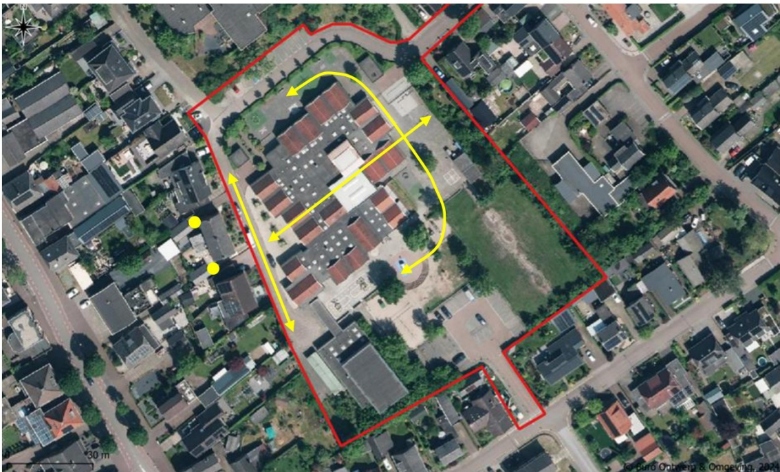
Figuur 10. Vliegbewegingen (pijlen) en nestlocaties van de gierzwaluw (stippen).

Het eerste onderzoek naar de gierzwaluw vond plaats in de avond van 18 juni 2025. Vanaf de start van het onderzoek werden meerdere gierzwaluwen waargenomen boven het projectgebied. Hierbij werd de soort vaak op en neer passerend gezien over het schoolgebouw. Het hoogtepunt van de activiteit vond plaats ter hoogte van het Pastoor Bluemersplein, ten westen van het schoolgebouw. Hier werden tenminste 10 exemplaren gezien die gierend en rakelings langs de gevels van de huizen in deze straat vlogen. Vanaf 22:12 werd de soort hier invliegend gezien op zowel Pastoor Bluemersplein 6 en 7 (Figuur 10). Bij beide adressen bevindt de nestlocatie zich onder de dakrand aan de achterzijde van de woningen (Figuur 11). In de onderzochte bebouwing werden geen nestlocaties van de gierzwaluw waargenomen.