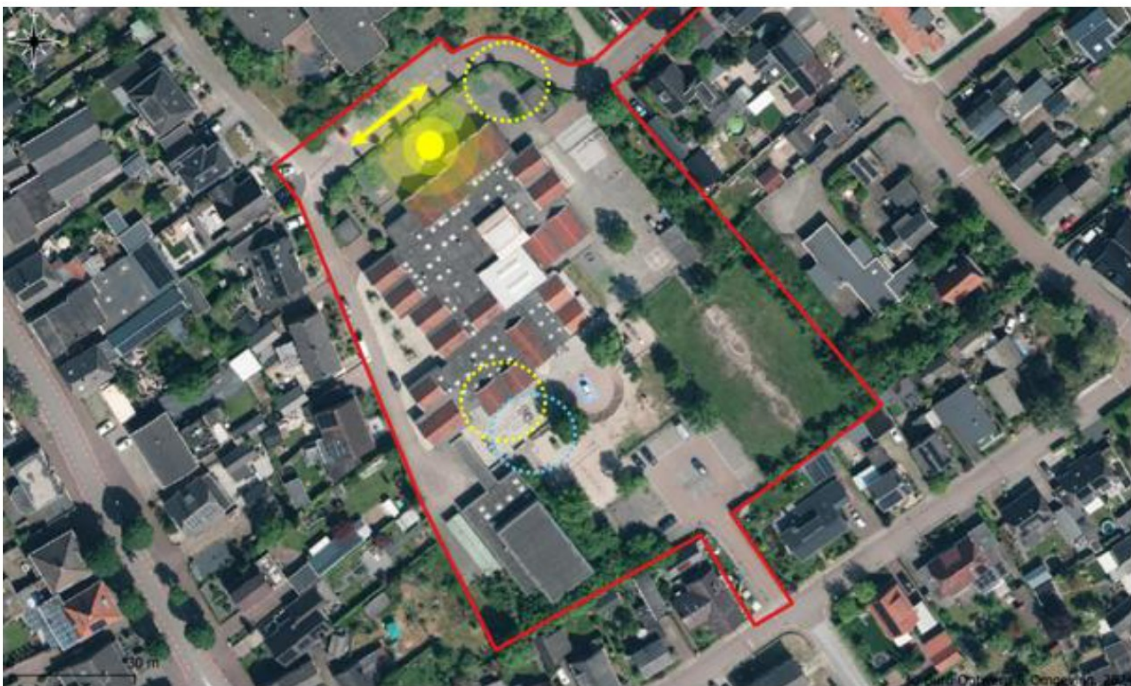
Figuur 8. Waarnemingen van foerageergedrag (gestippelde cirkels), vliegbewegingen (pijlen) en baltsgedrag (gebufferde cirkel) van de gewone dwergvleermuis (geel) en rosse vleermuis (lichtblauw).

Het vierde vleermuisonderzoek vond plaats in de late avond en nacht van 14 op 15 augustus 2025. Tijdens het onderzoek werd de gewone dwergvleermuis in vrijwel het gehele gebied waargenomen. In de meeste gevallen ging het om passerende of kort foeragerende exemplaren. Aan de noordwestkant van het schoolgebouw werd echter ook een baltsterritorium vastgesteld. Er werd geen zwermgedrag van gewone dwergvleermuis waargenomen. Verder werd wel drie keer een passerende laatvlieger vastgesteld en werd er eenmalig foerageergedrag vastgesteld van de rosse vleermuis waargenomen. De waarneming van de rosse vleermuis vond plaats om 00:59 tussen het schoolgebouw en de gymzaal (Figuur 8). De laatvlieger en rosse vleermuis toonden geen verdere binding met het projectgebied.