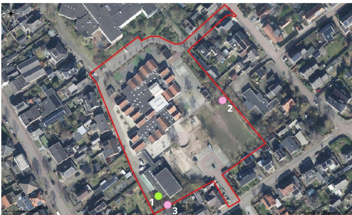
Figuur 2. Opstelling onderzoeksmateriaal in het projectgebied met een marterbox (groene stip) en vrijstaande cameravallen (roze stippen).

Voor de steenmarter is geen onderzoeksprotocol beschikbaar. Om onderzoek naar deze soort te kunnen doen is eveneens gebruik gemaakt van de onderzoeksmethoden naar kleine marterachtigen, zoals gehanteerd in het kennisdocument van BIJ12 (BIJ12, 2024). Hiermee kan ook de steenmarter worden vastgesteld.