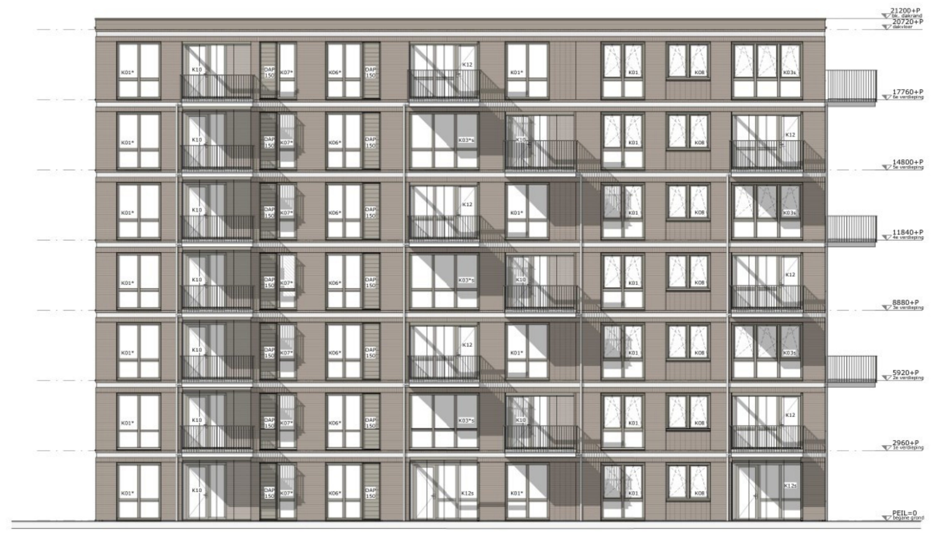
blok A zijgevel links