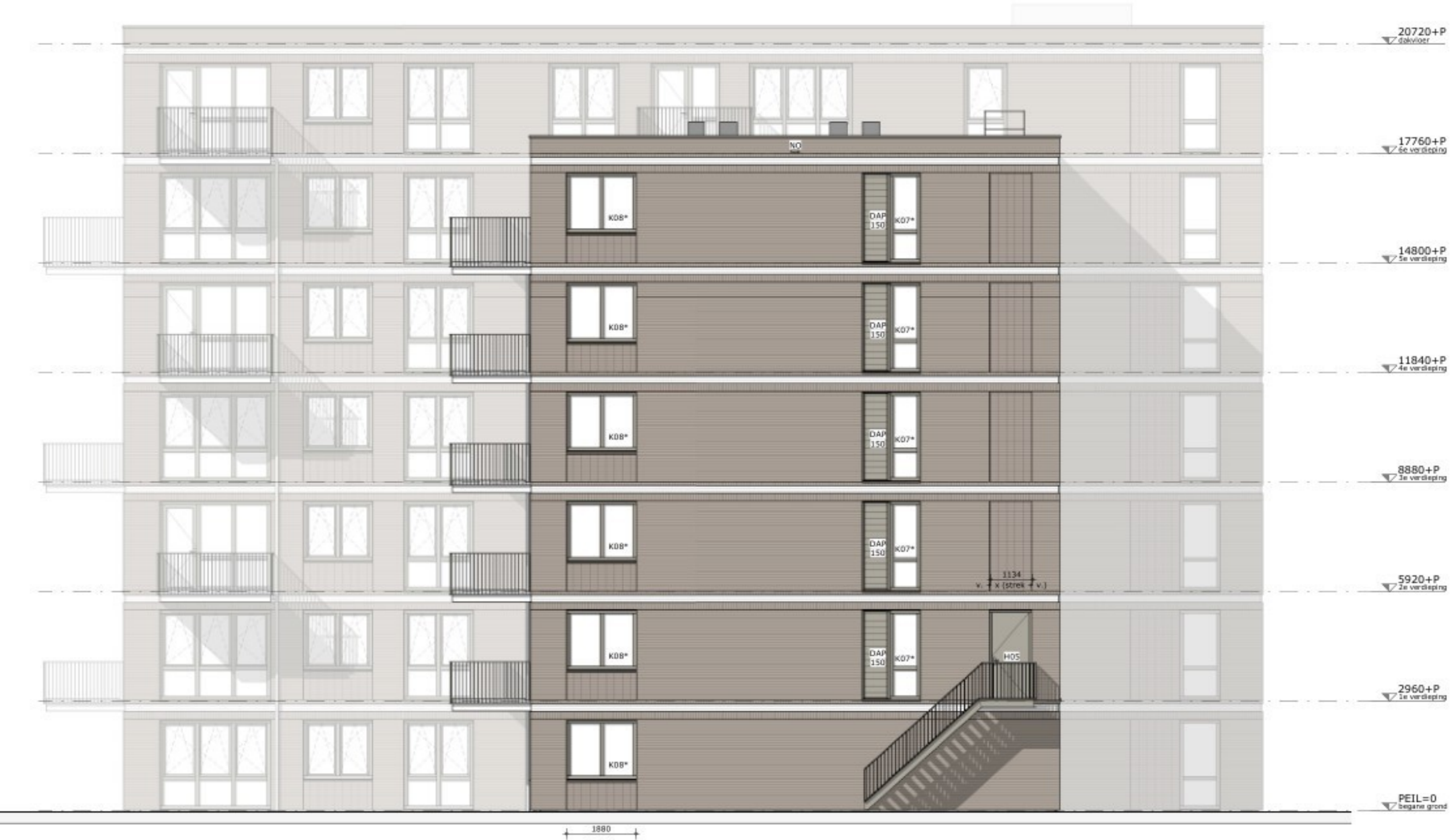
blok B zijgevel rechts

PROJECT DUNANTWEG 12-14, DEURNE WERKNUMMER E25/3853 OPDRACHTGEVER DW14 B.V. TEKENINGENUMMER TO-200 TITEL TECHNISCH ONTWERP GEVELS DATE 05-06-2026 SCHAAL 1:100 REVISIE FORMAAT A0 REVISIESTADIUM MODELLER JM