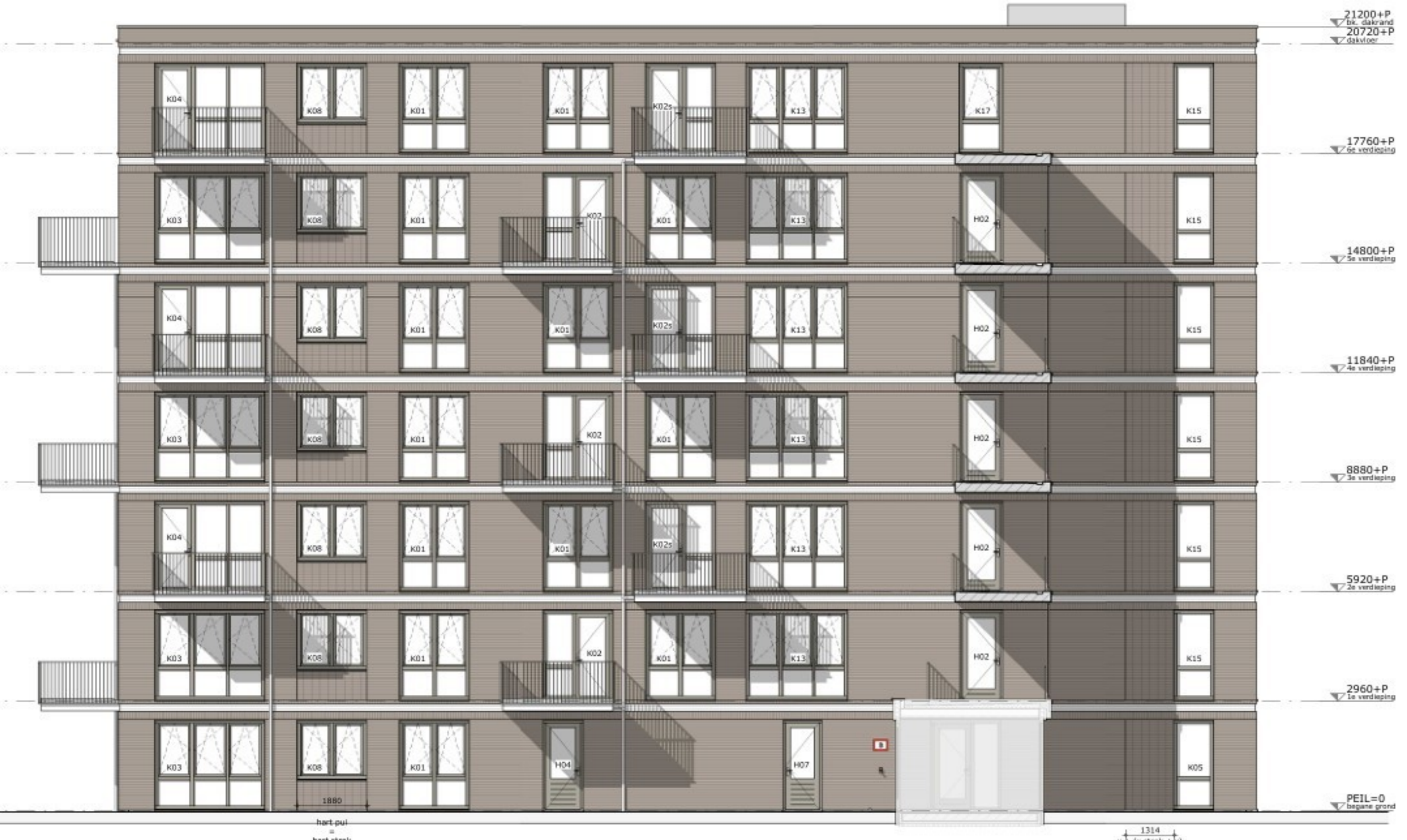
blok A zijgevel rechts