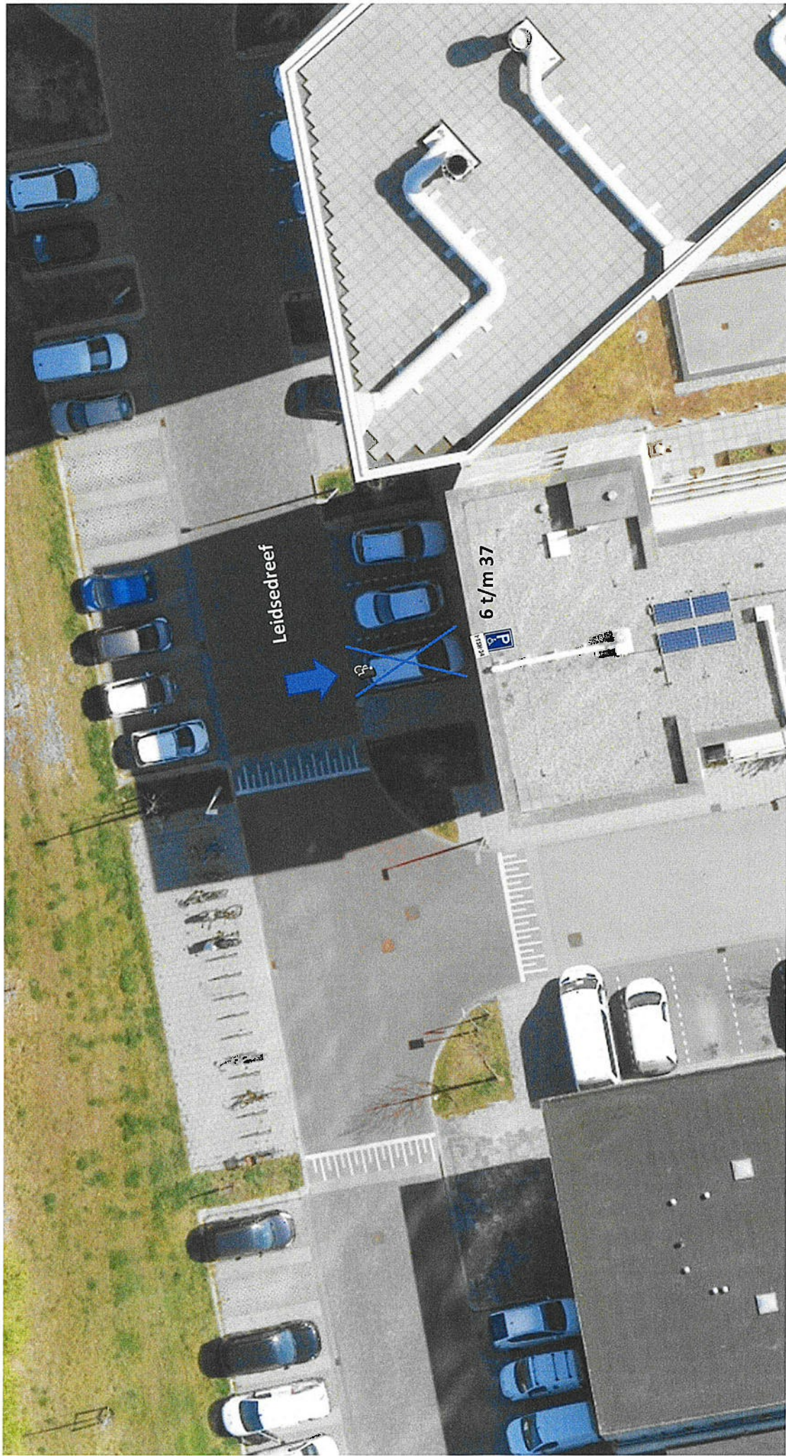
Tekening behorend bij verkeersbesluit aanwijzen gereserveerde gehandicaptenparkeerplaats aan de Leidsedreef, Z/26/198894/466444