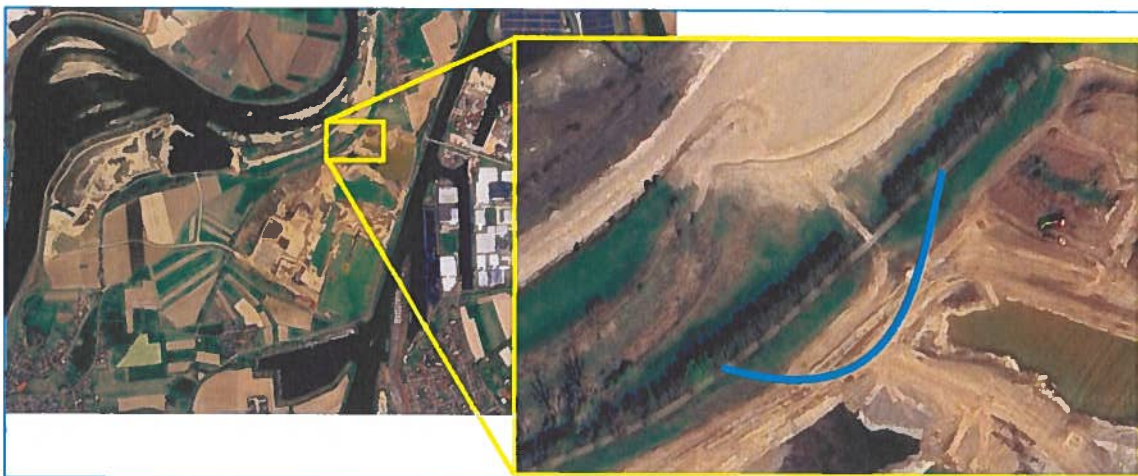
Figuur 1 – traject van de bypass

In onderstaande paragrafen wordt het voornemen verder toegelicht.