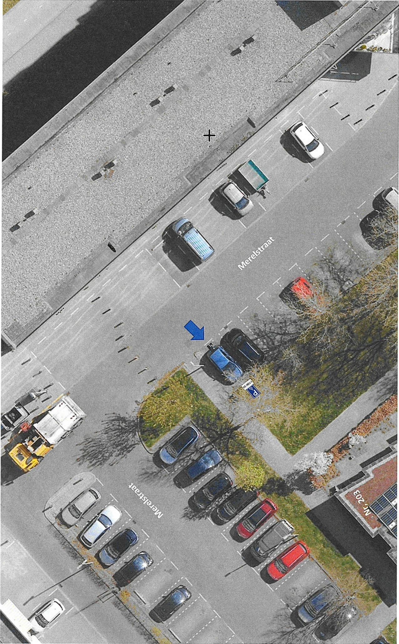
Tekening behorend bij verkeersbesluit aanwijzen gereserveerde gehandicaptenparkeerplaats aan de Merelstraat, Z/26/198646/465885