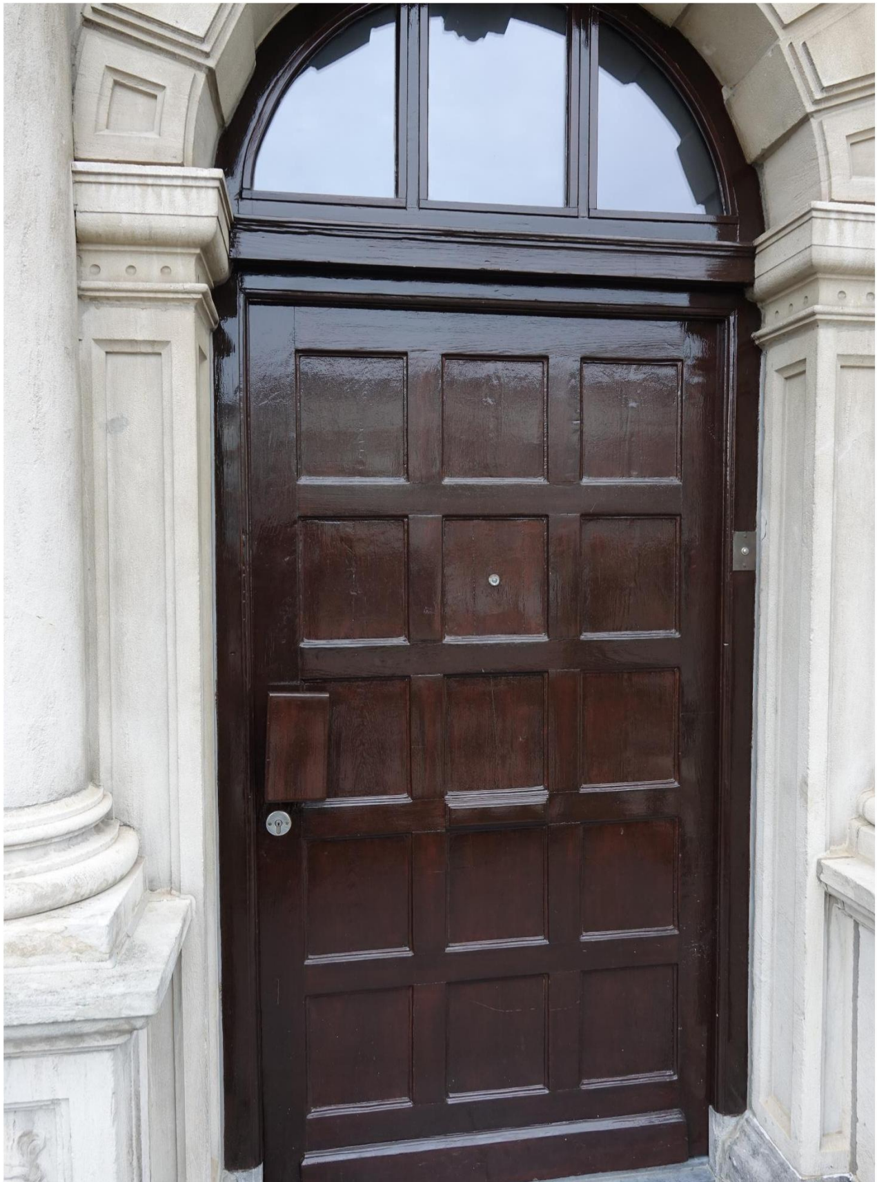
Figuur 16 Deurkozijn in goede staat