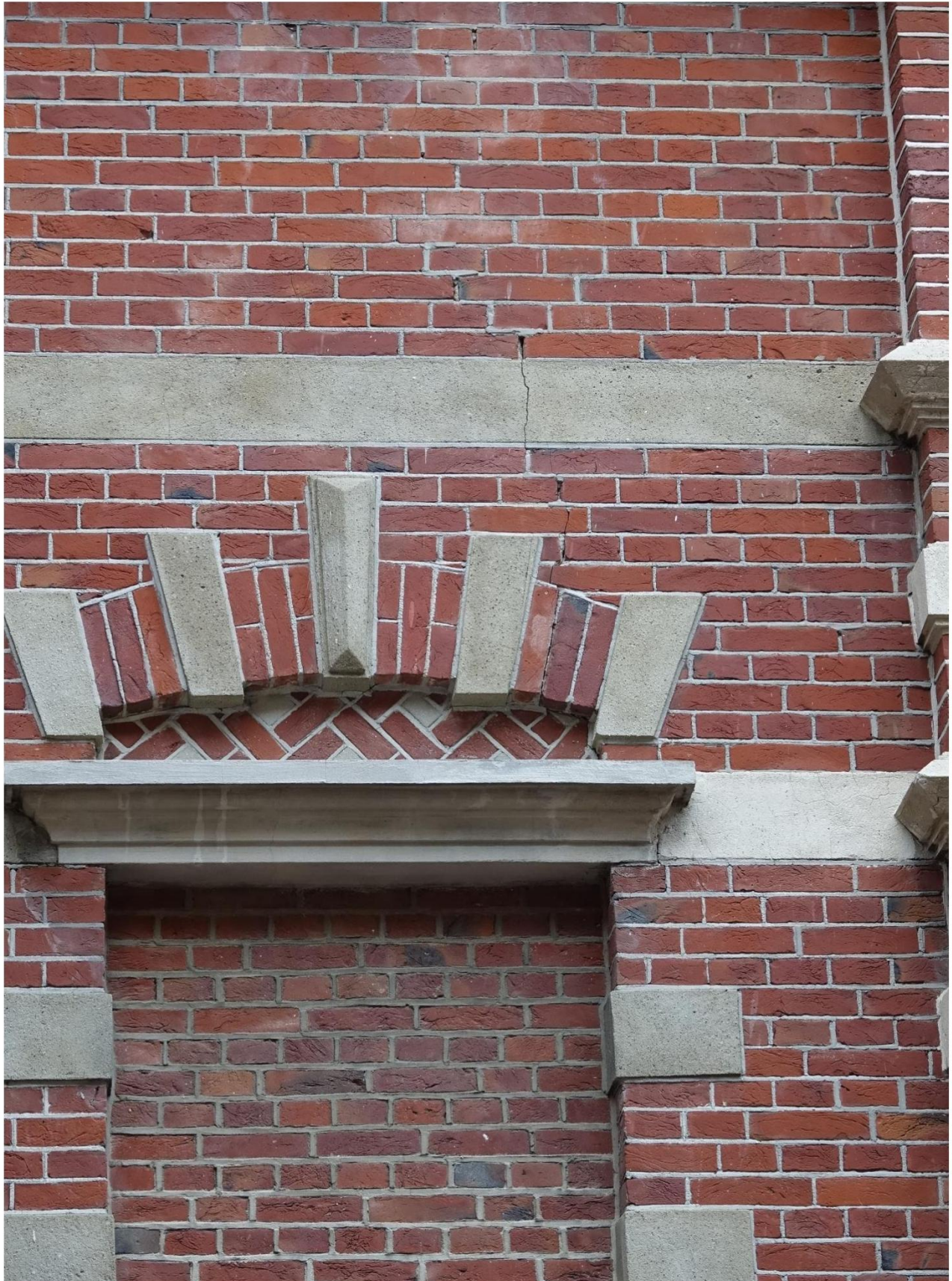
Figuur 18 Scheur in gevel