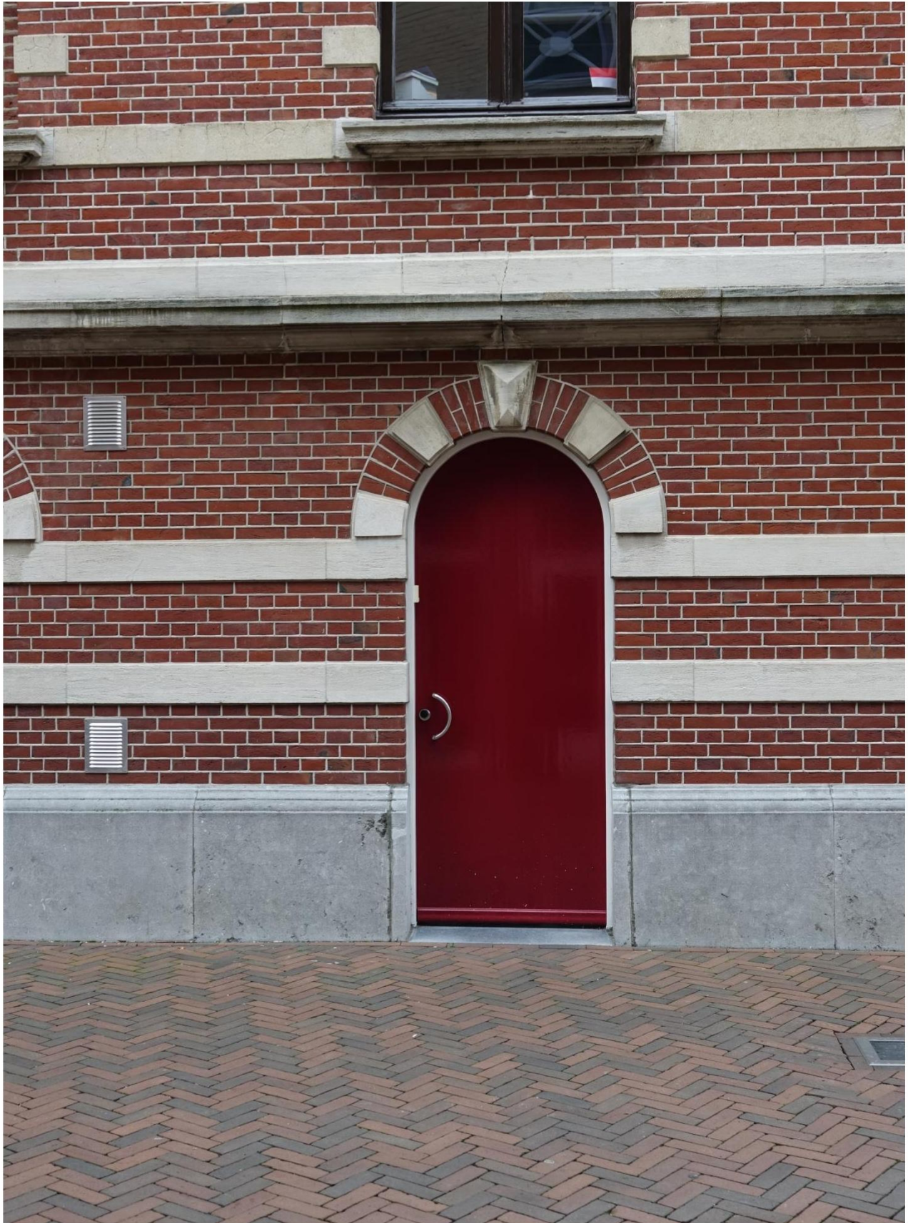
Figuur 17 Deurkozijn in goede staat