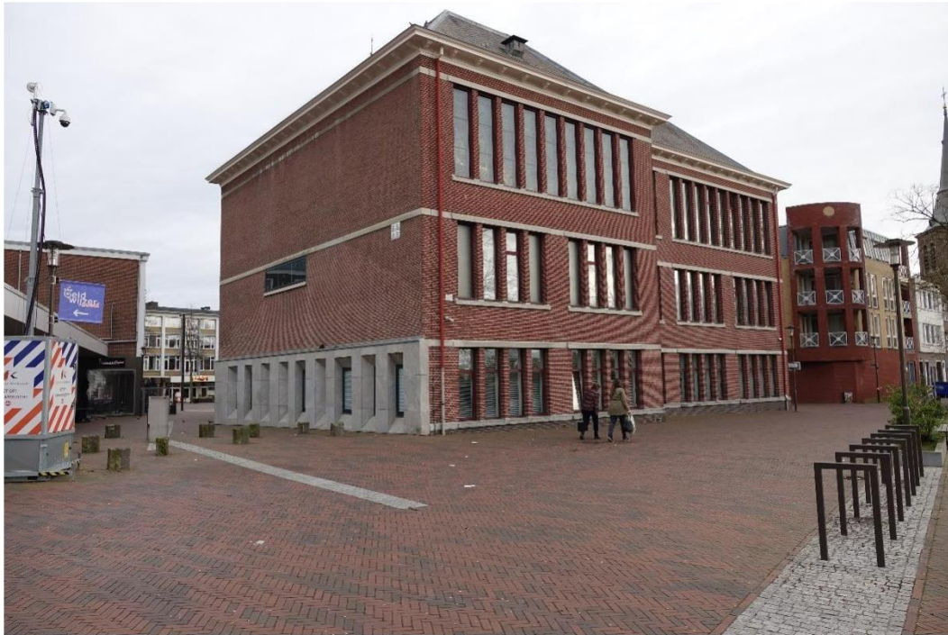
Figuur 4 Overzicht foto achtergevel en rechter zijgevel