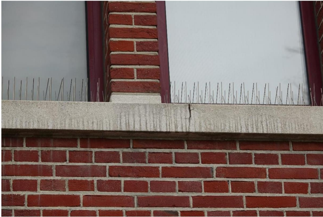
Figuur 9 Scheuren in zandsteen lijst