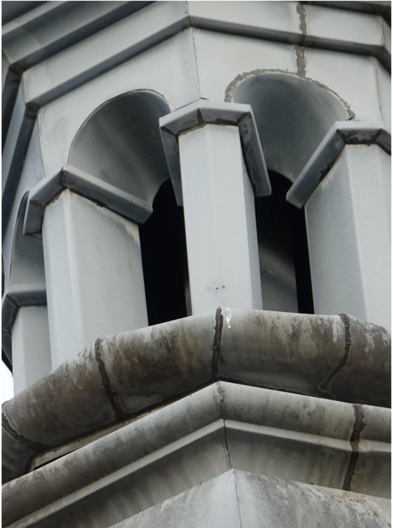
Figuur 14 Close-up zinken toren