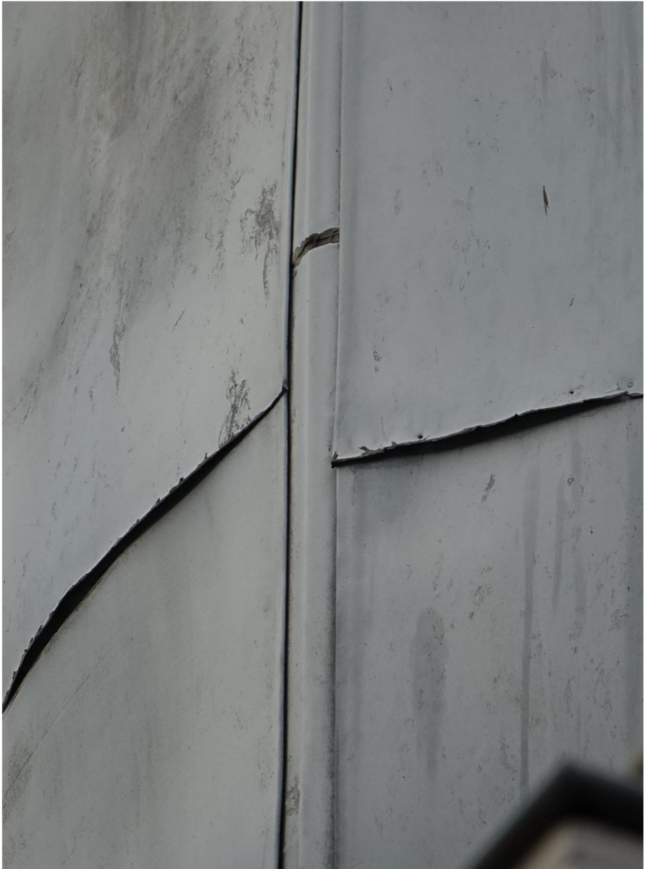
Figuur 6 Close-up foto zinken toren, loszittend zinkwerk