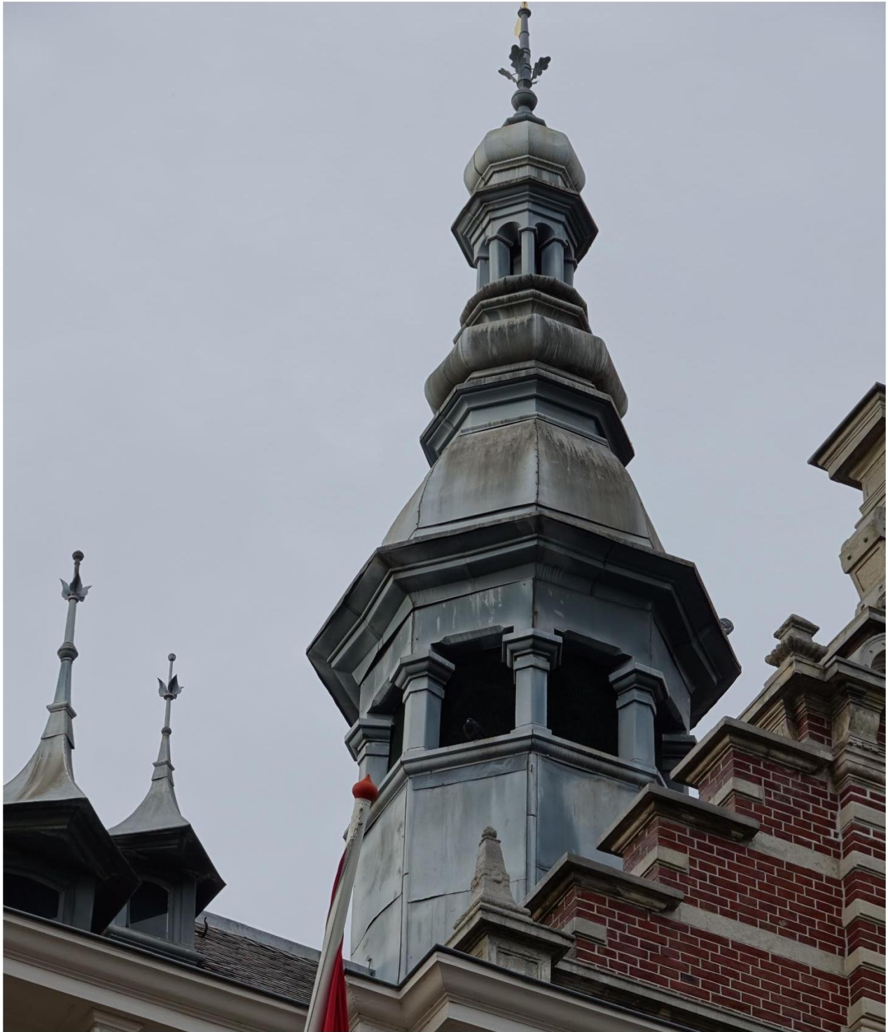
Figuur 5 Overzicht foto zinken toren