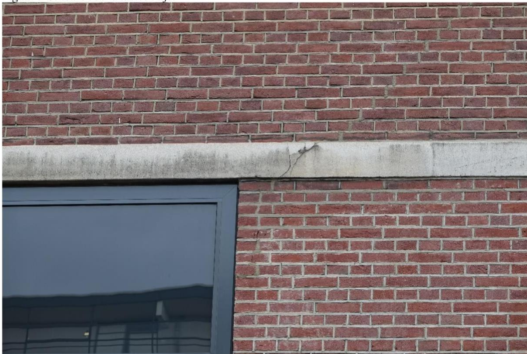
Figuur 10 Scheuren in zandsteen lijst