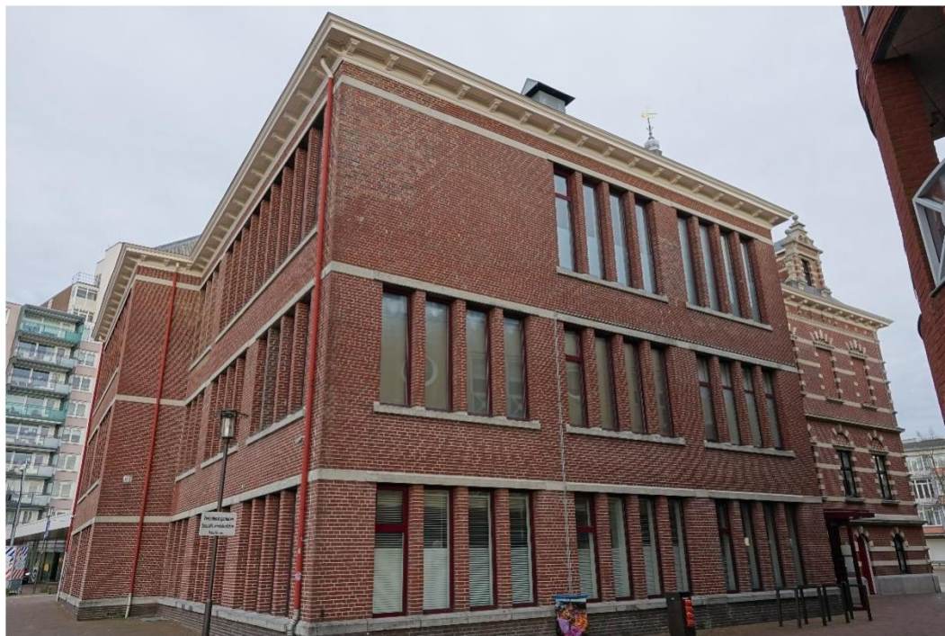
Figuur 2 Overzicht foto linker zijgevel