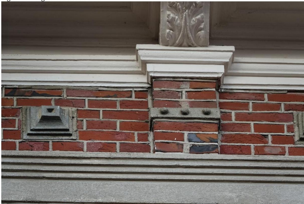
Figuur 14 Voegwerk in slechte staat