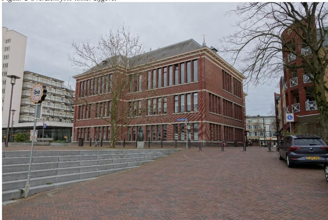
Figuur 3 Overzicht foto achtergevel en linker zijgevel