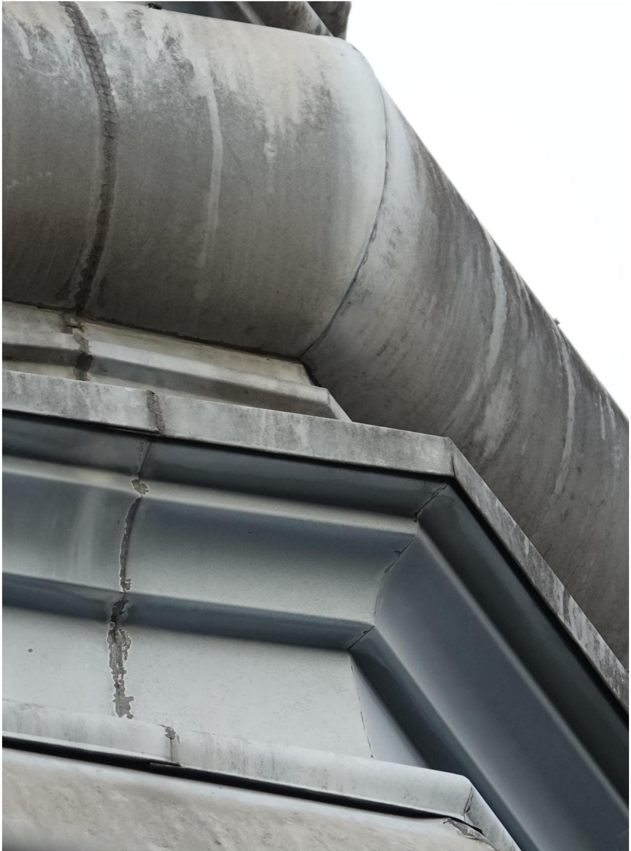
Figuur 8 Close-up zinken toren