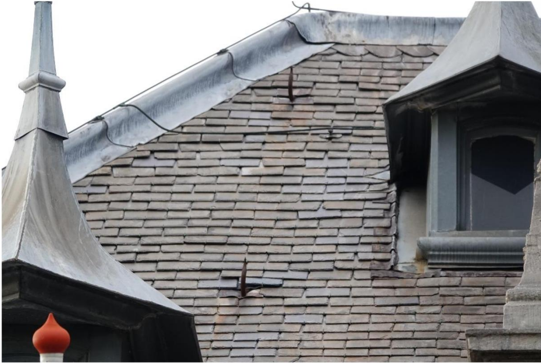
Figuur 7 Leien dakvlak 2