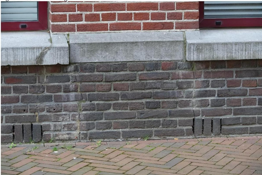
Figuur 12 Scheuren in plint