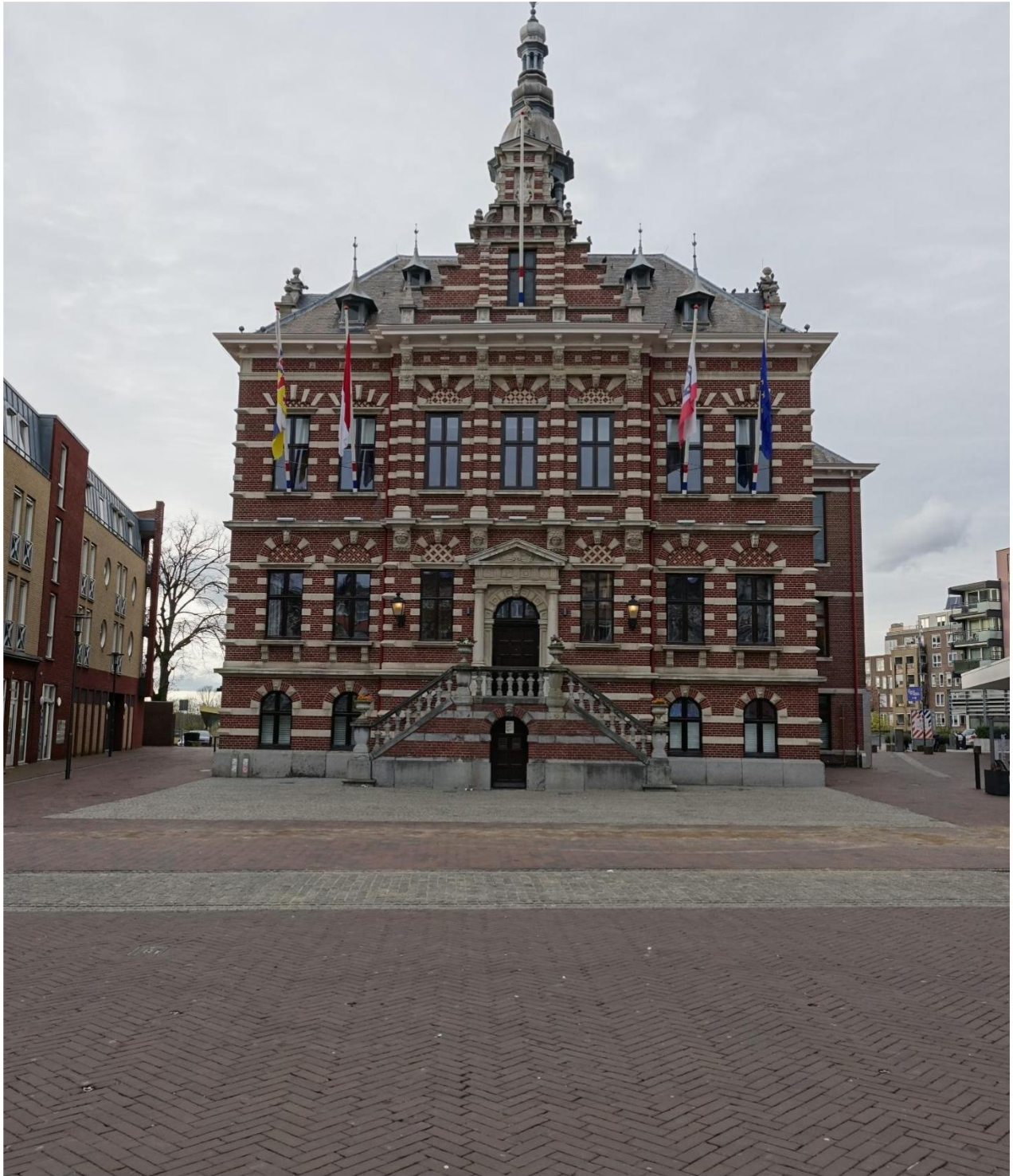
Figuur 1 Overzicht foto voorgevel