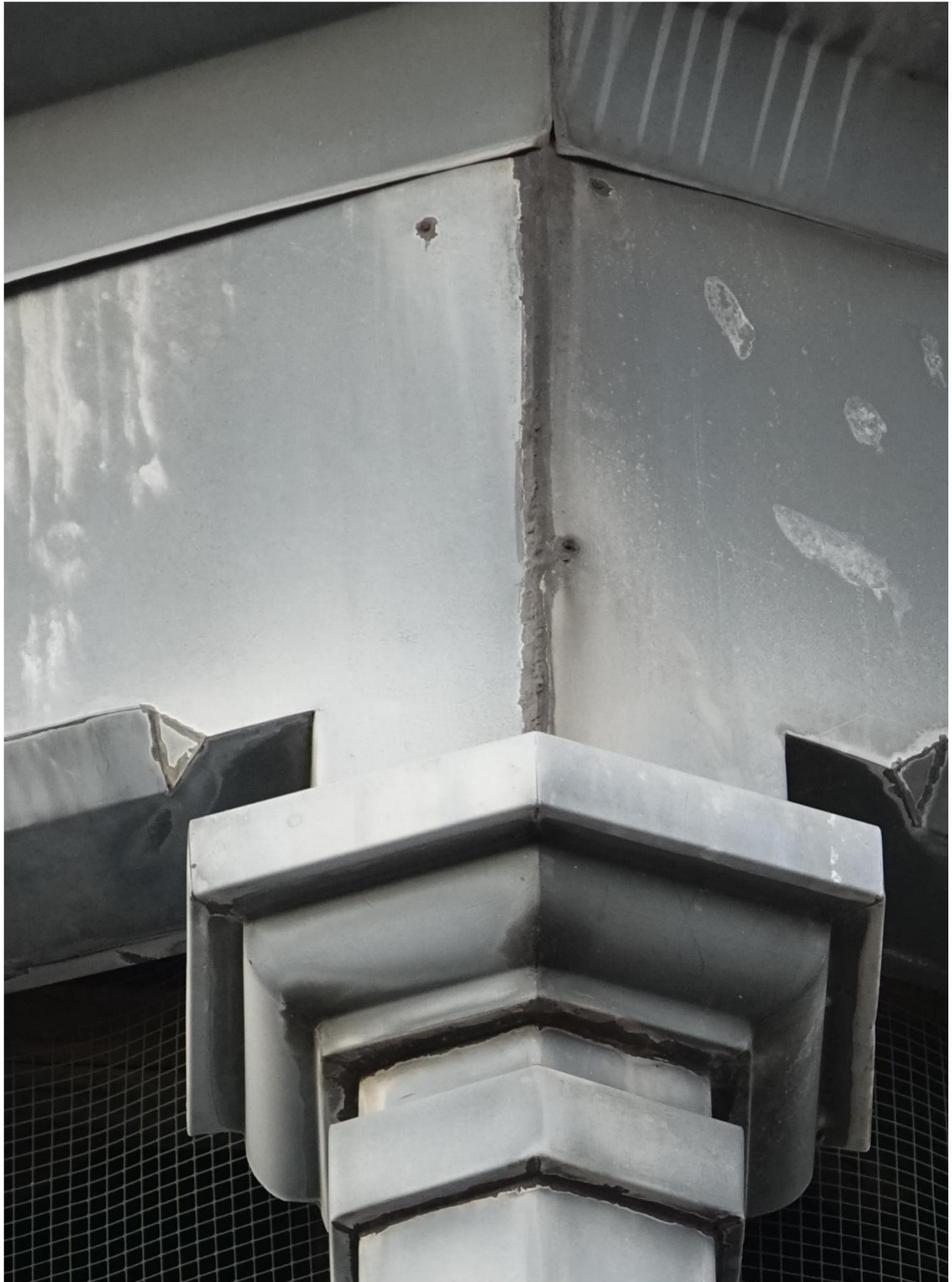
Figuur 7 Close-up zinken toren