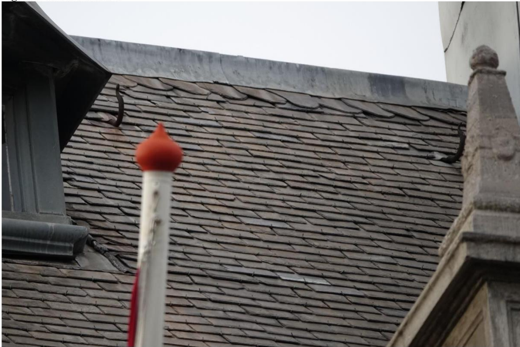
Figuur 8 Leien dakvlak 2