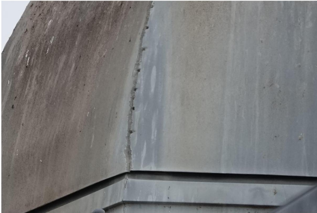
Figuur 9 Close-up foto zinken toren