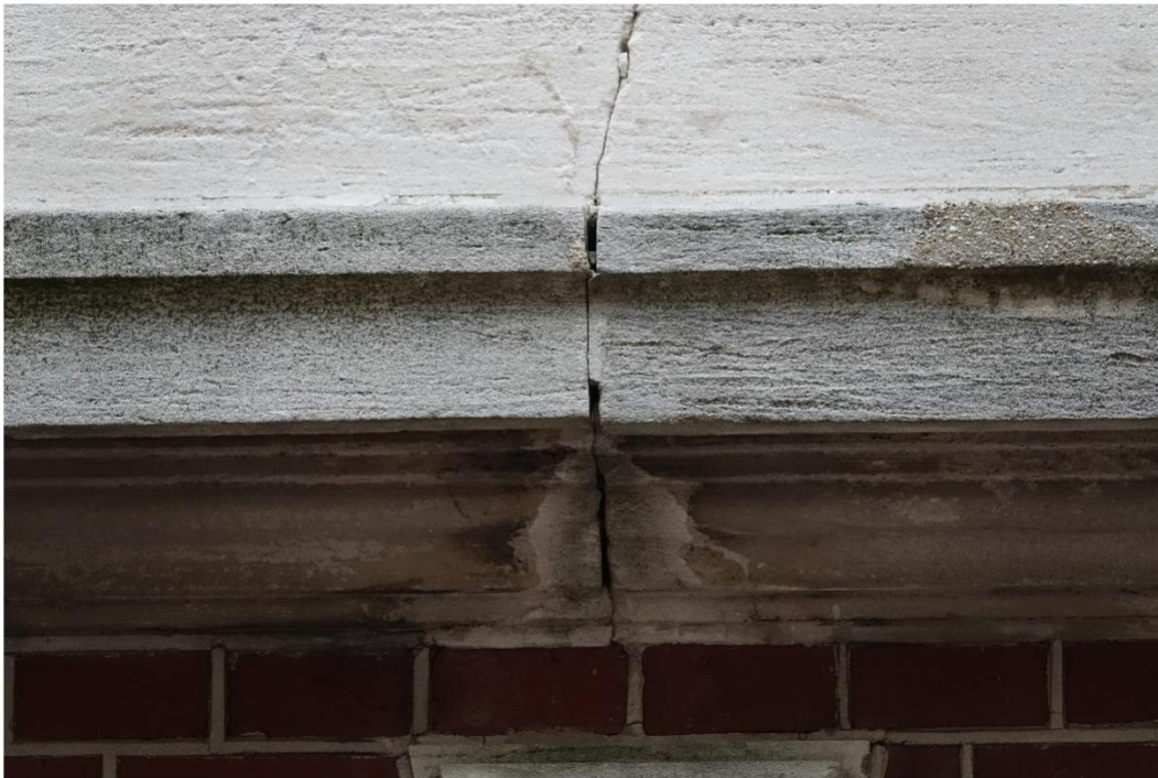
Figuur 11 Scheuren in voeg