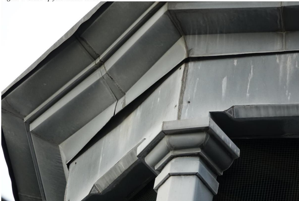
Figuur 5 Close-up foto zinken toren, loszittend zinkwerk