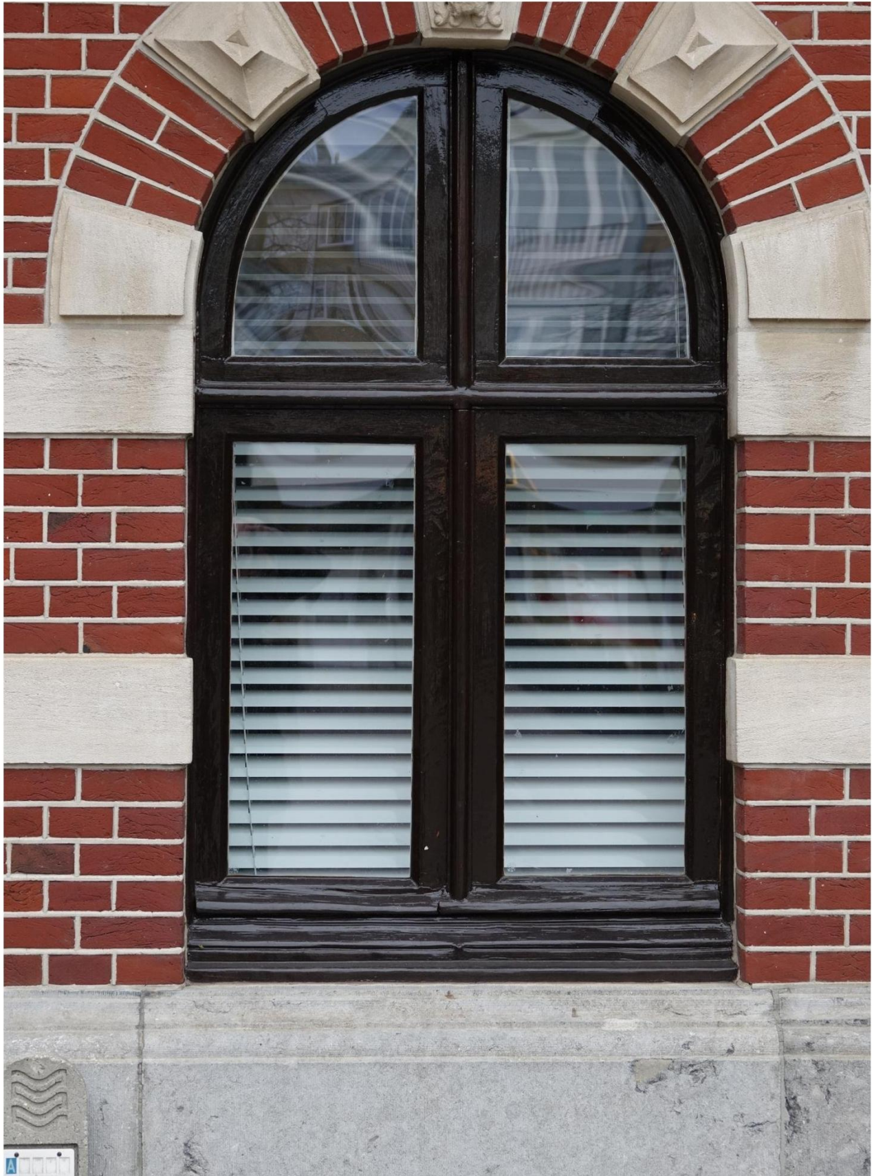
Figuur 15 Raam kozijn