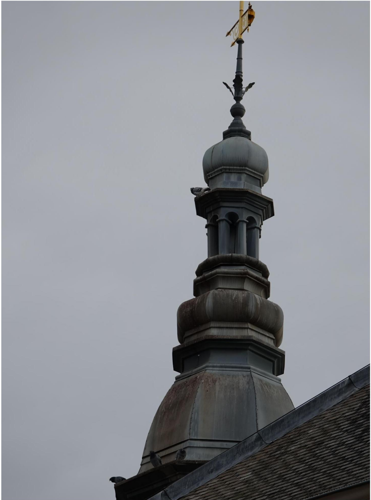
Figuur 6 Overzicht foto zinken toren