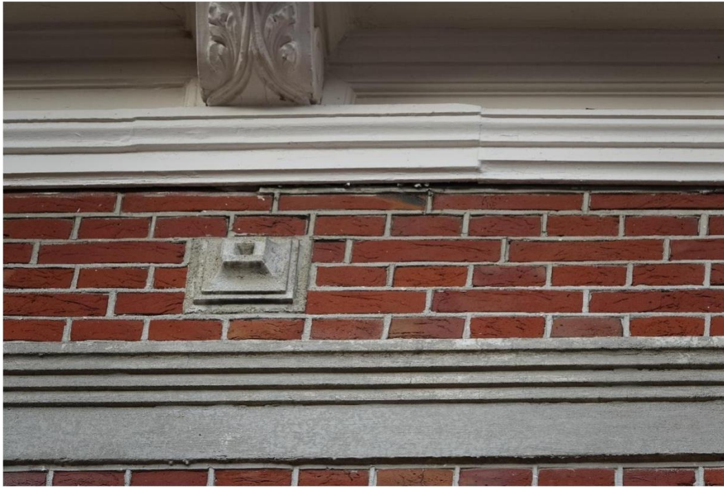
Figuur 13 Voegwerk in slechte staat