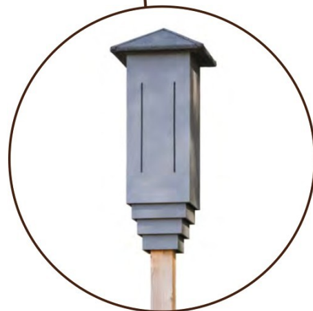
Vleermuis paalkasten aan weerszijden front