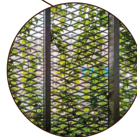
Robuust frame met semi-transparant, hekwerk. Begroeid met Hedera helix