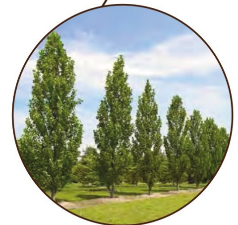
Inheemse bomen flankeren en versterken frontwerking