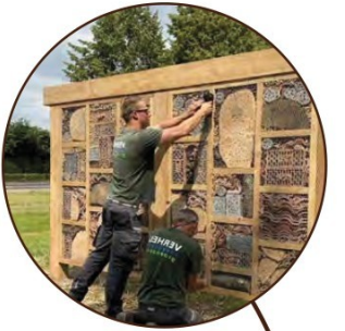
Goed bijenhotel, nabij bloemrijke wadi