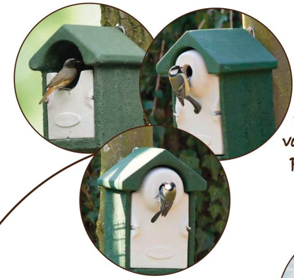
Duurzame nestkasten voor huismus, kool-, pimpelmees en zwarte roodstaart aan noordzijde van het front