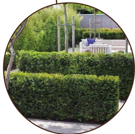
Front geflankeerd door inheemse lage hagen (ca. 1.2m hoog)