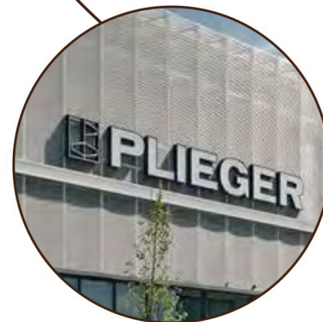
Gevelreclame met dieptewerking (onverlicht)