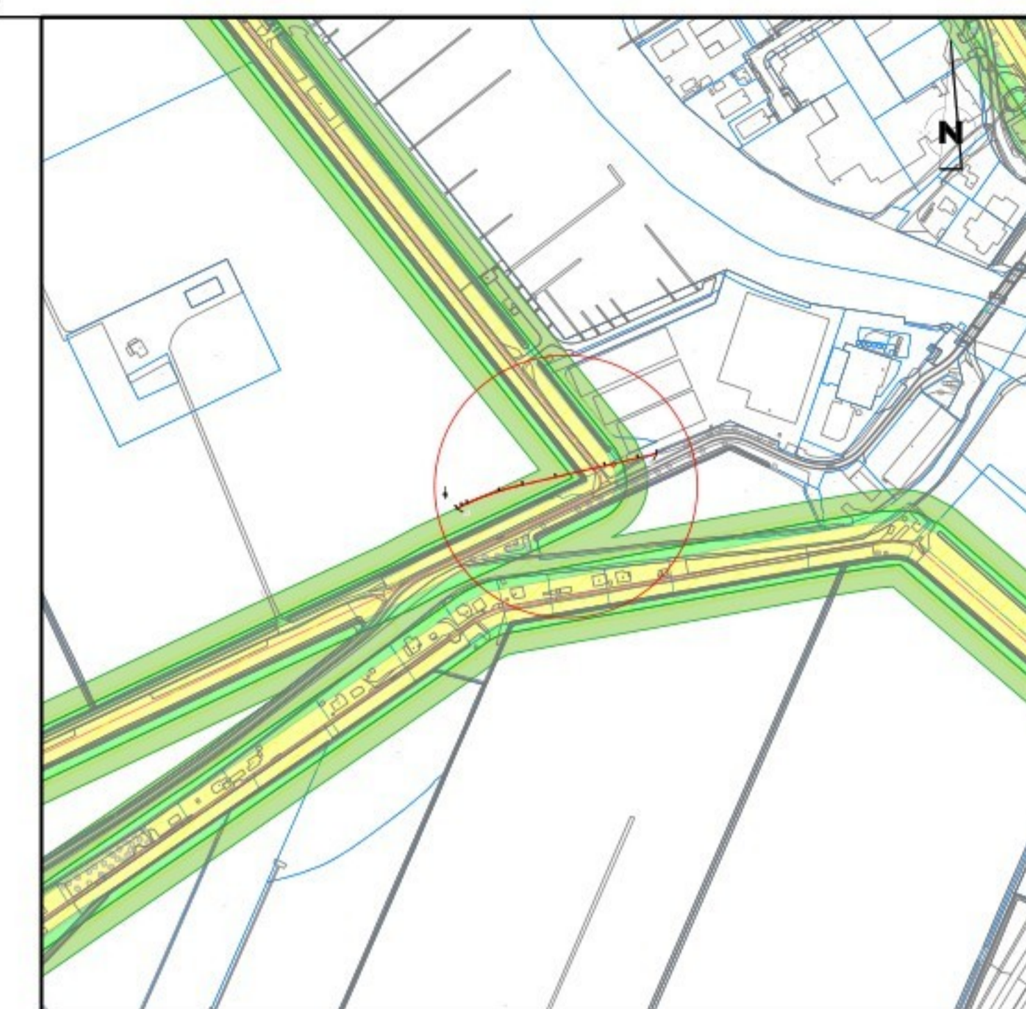
OVERZICHT SCHAAL 1 : 5000