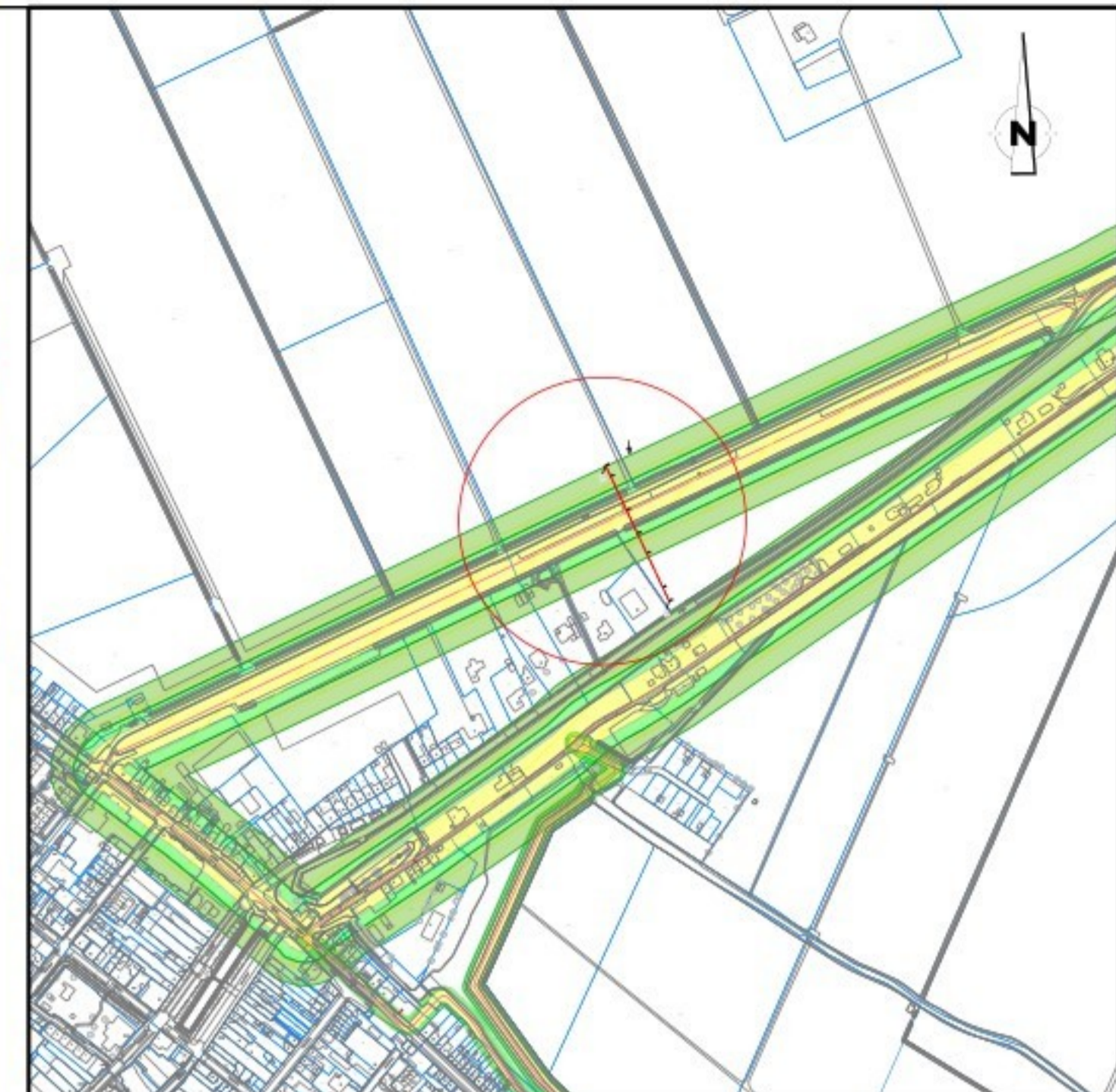
OVERZICHT SCHAAAL 1: 5000