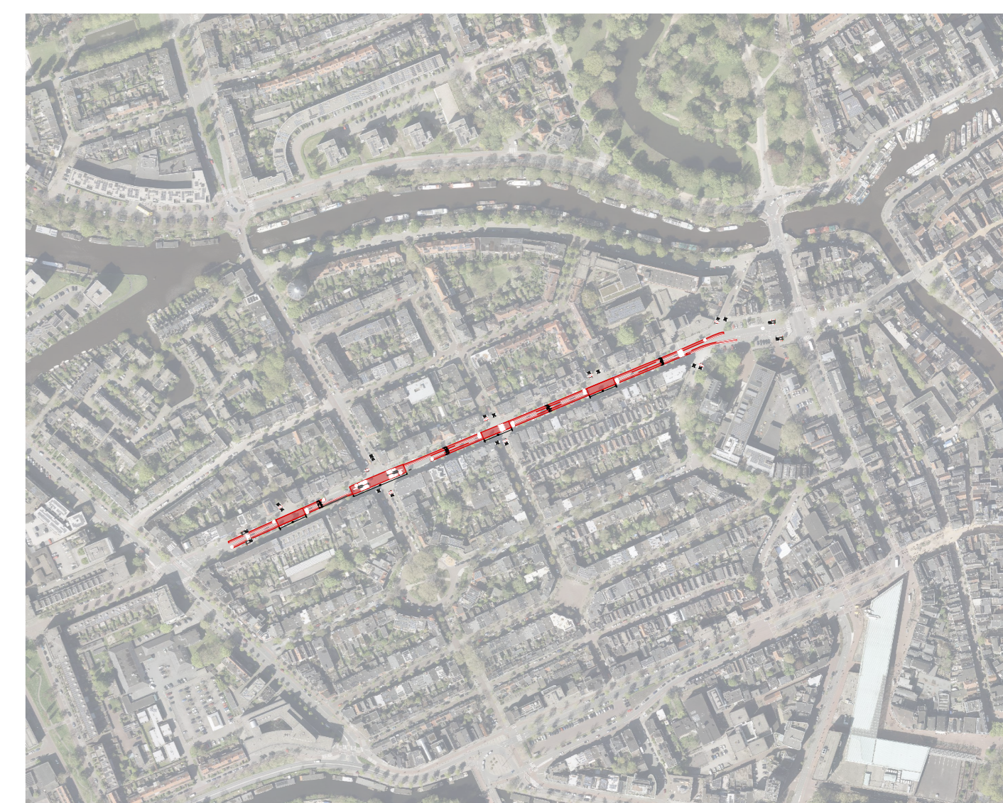
TOTAAL SITUATIE schaal 1:5000