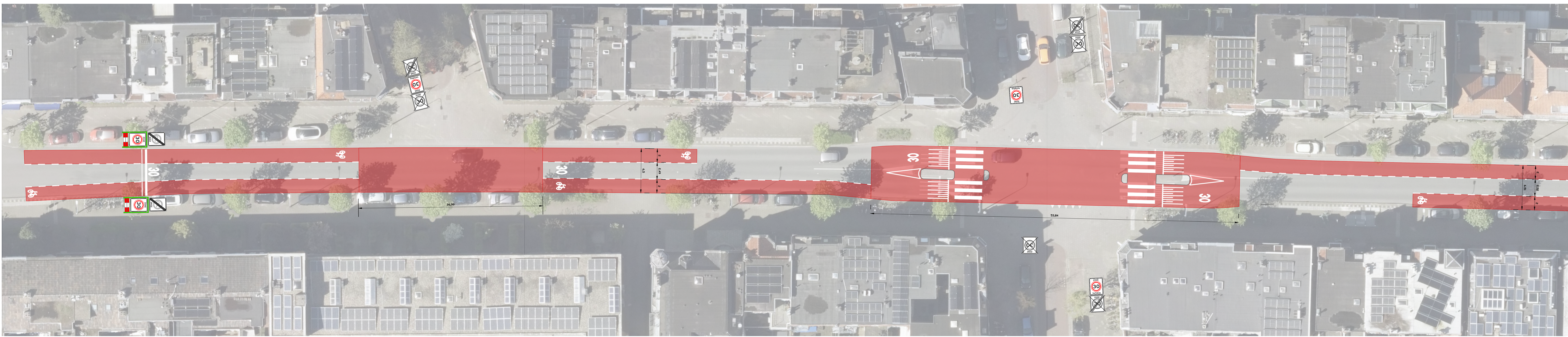
SITUATIE (deel 1) schaal 1:200