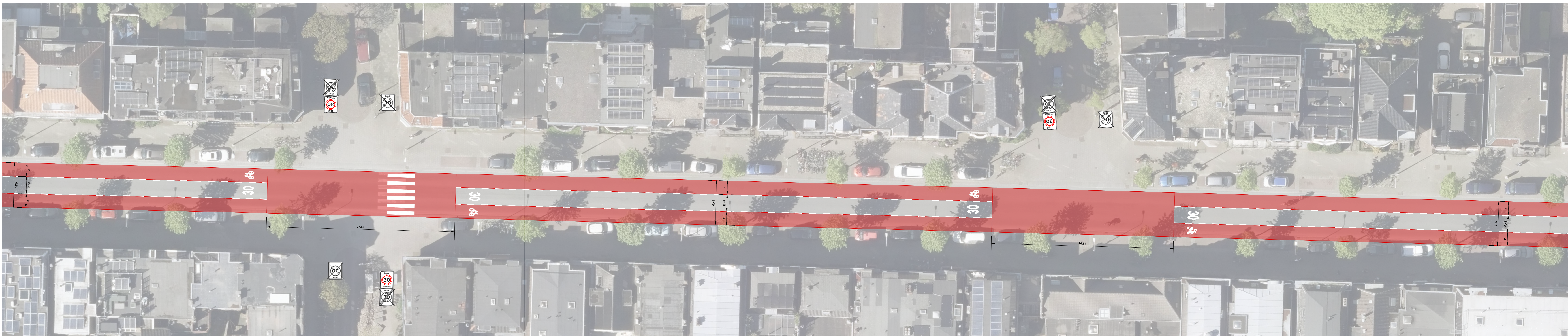
SITUATIE (deel 2) schaal 1:200