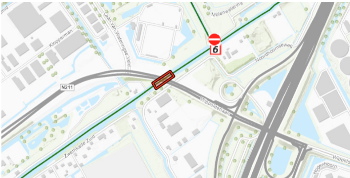
Figuur 1: Locatie gedeeltelijke stremming (rode rechthoek) Aangezien de stremming in het vaarseizoen 2026 plaatsvindt en deze vaarweg een belangrijke verbinding vormt binnen het vaarnetwerk, is besloten een stremmingsbesluit af te geven.