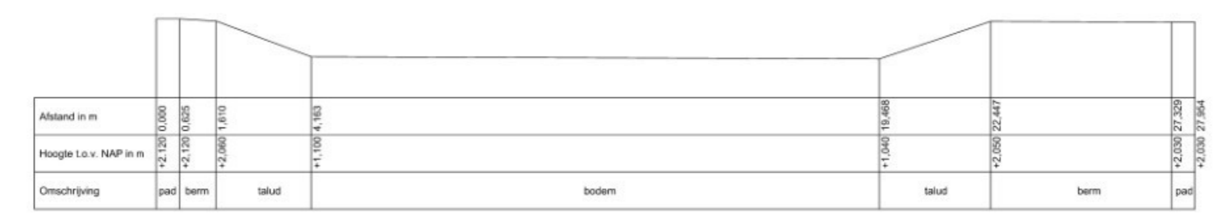
Profiel B - B' Schaal 1 : 100