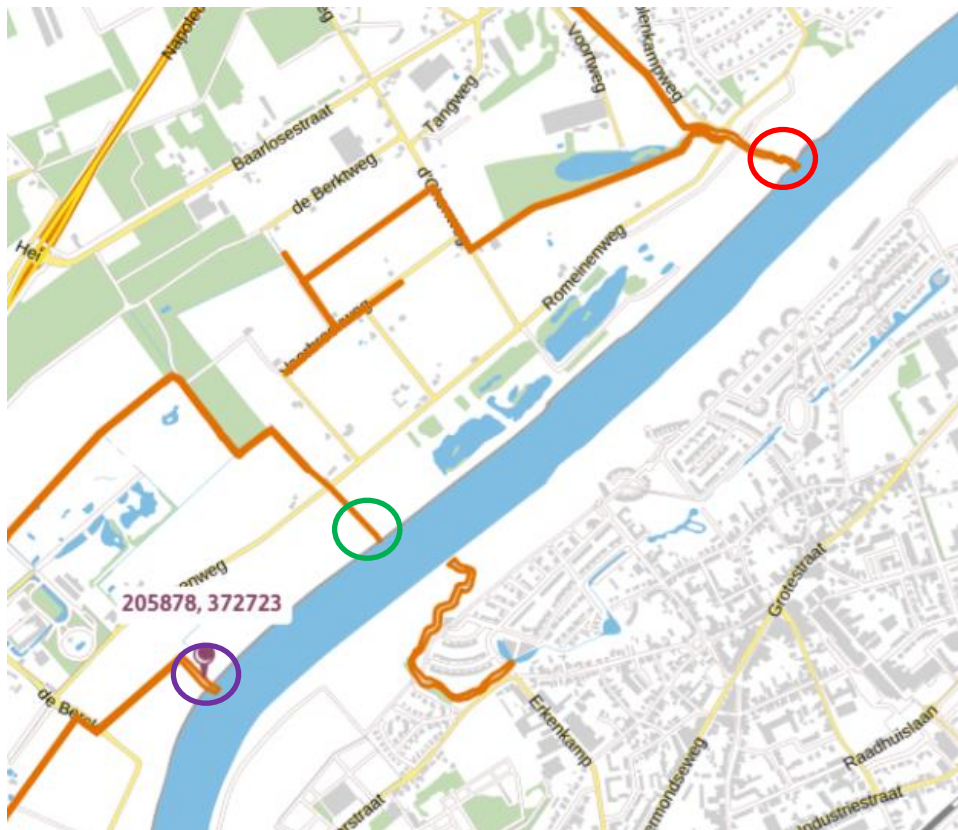
Afbeelding 2: uitsnede legger met zoneringen oppervlaktewateren en beekmondingen: