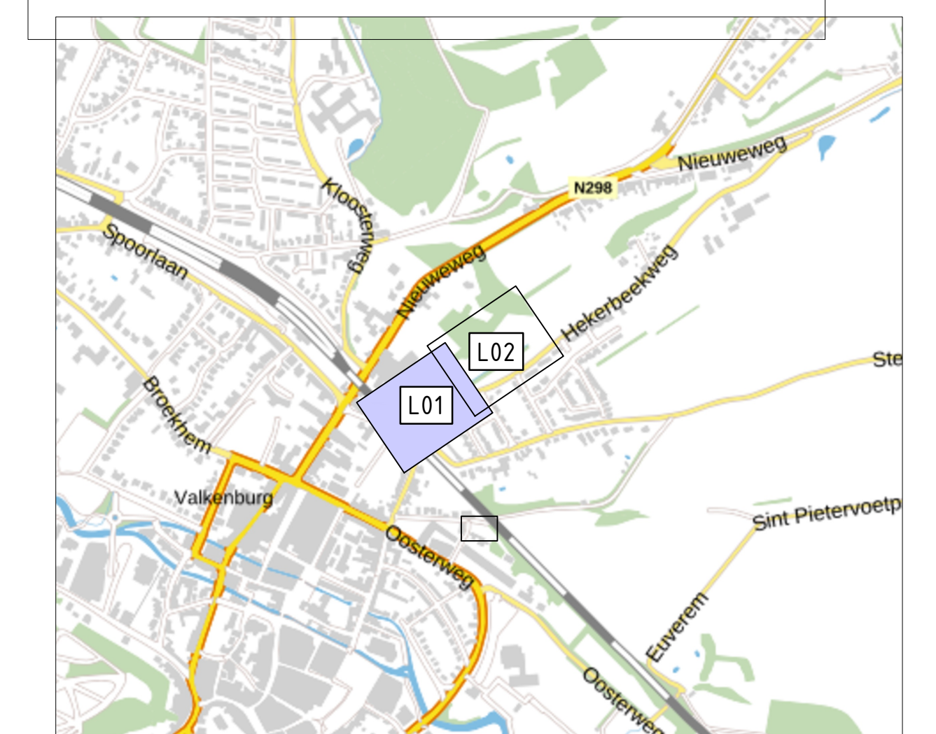
Overzicht deelgebied 6 SCHAAL 1: 10.000

Specificatie valbeveiliging: Leuning van RVS stiplen 70x5mm h.o.h. 125 m (2 stl) bevestigen op stapelmuur en bevestiging met schuif van RVS voetplaat 90x100x25 mm en 4 anker M12 (2stl) op de uitstroombak