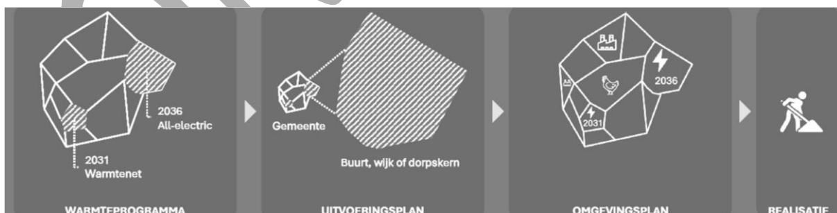
Figuur 1: Proces warmteprogramma tot realisatie aardgasvrij

In een warmteprogramma beschrijven gemeenten in welke gebieden zij de komende jaren aan de slag gaan met verduurzaming en het aardgasvrij maken van gebouwen, en wanneer zij verwachten het gebruik van aardgas daar daadwerkelijk te beëindigen. Hiermee vormt het programma een eerste richtinggevende stap naar een aardgasvrije gebouwde omgeving, zoals weergegeven in figuur 1.