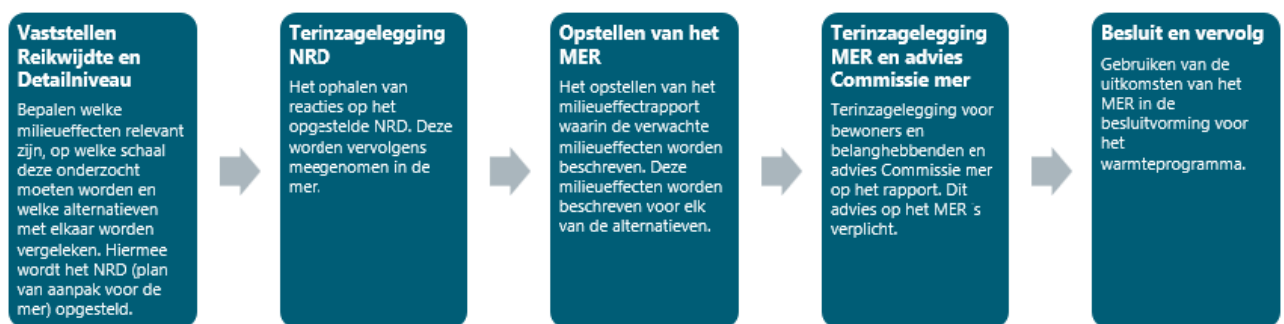
Figuur 2: Proces NRD tot MER

Gezien de mogelijke inzet van technieken als bodemenergie, geothermie (G4) en (lokale) infrastructuur (J9) binnen het warmteprogramma, is het aannemelijk dat een plan-MER verplicht is. Wanneer kaderstellende keuzes gemaakt worden in het warmteprogramma, die invloed hebben op toekomstige besluiten, is het plan-MER verplicht. Het plan-MER wordt opgesteld op basis van de Notitie Reikwijdte en Detailniveau. De mer-procedure hangt nauw samen met het uitwerken en vaststellen van het warmteprogramma.