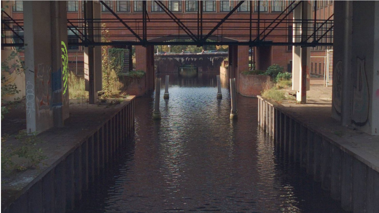
Figuur 2 Bakprofiel watergang

Het plaatsen en hebben van de overkluizing voldoet aan de beoordelingsregels zoals weergegeven in Artikel 4.6 van de waterschapsverordening Delfland en de beleidsregel werken in het profiel van wateren, specifiek hoofdstuk 4 "aanvullende inrichtingscriteria bruggen".