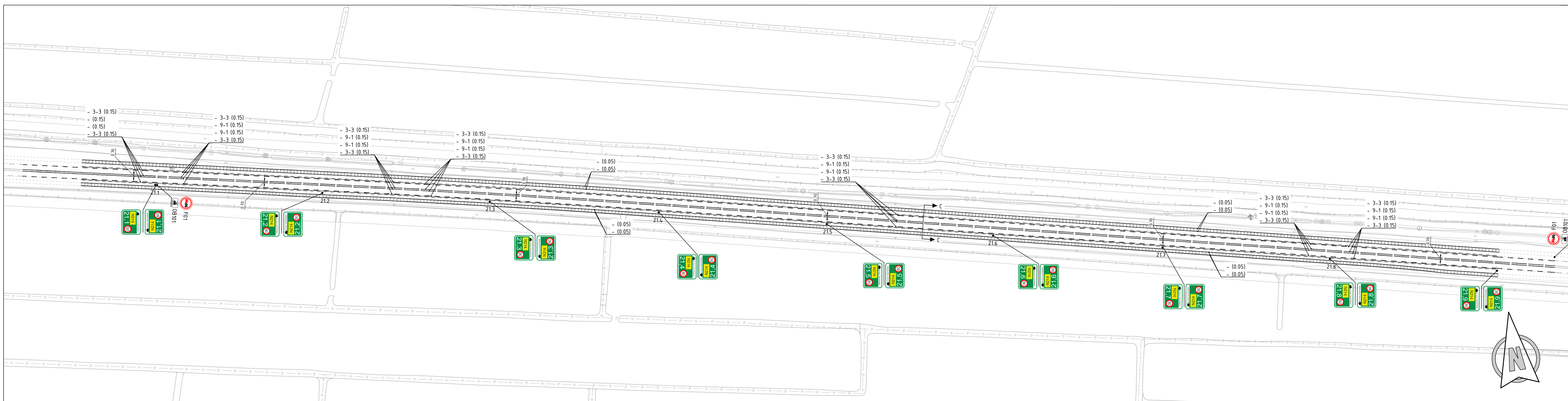
Situatie Schaal 1:1000