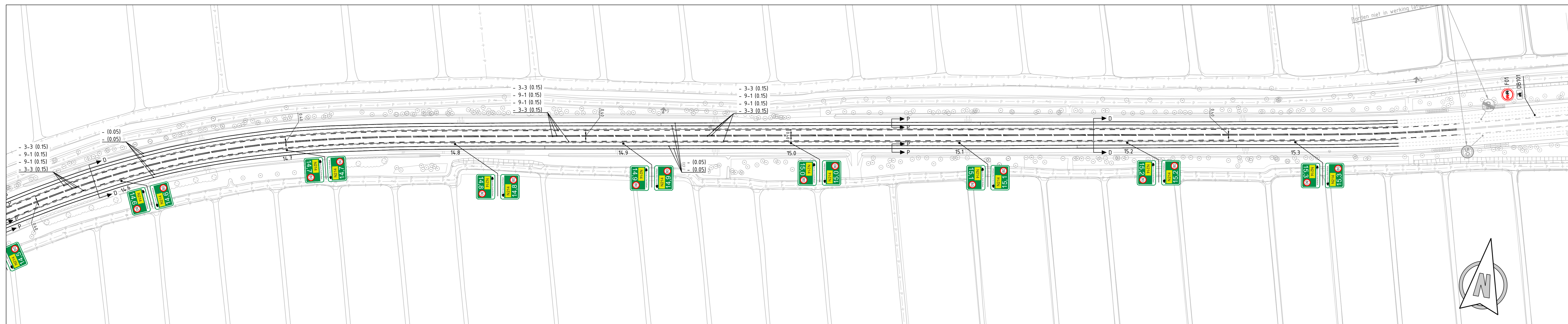
Situatie Schaal 1:1000