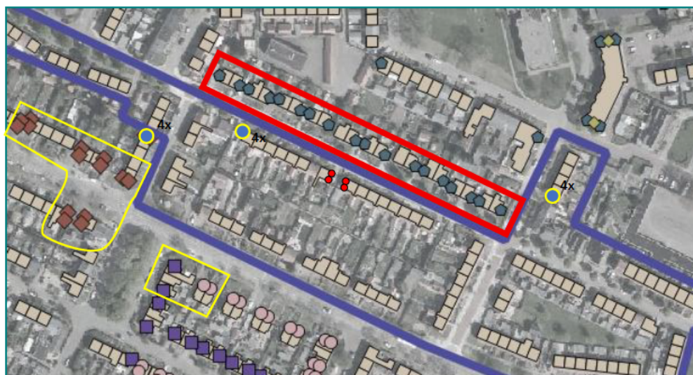
Figuur 4: Tijdelijke mitigatie kasten. Rode kader betreft het plangebied.

Kasten aanwezig uit voorgaand project binnen de beide gele vlakken: