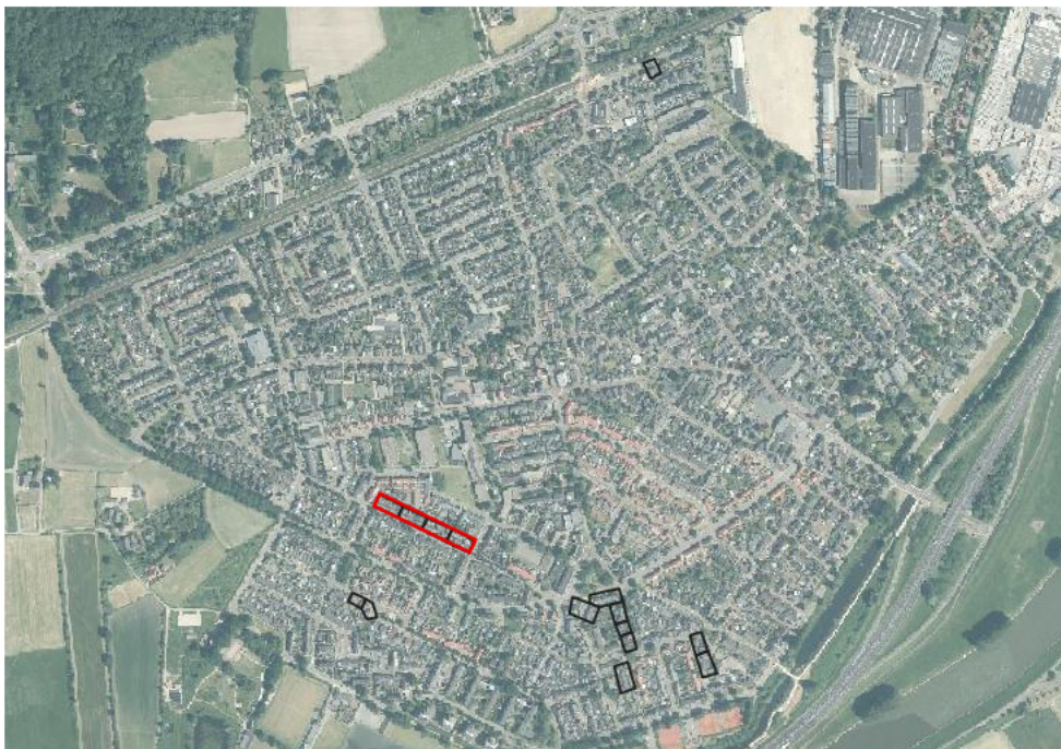
Figuur 1: Ligging van de woningen aan de Buurtweg (rode kader). De overige woningen vervallen alle.

Op voorhand wil ik u het volgende mededelen. Van het project zoals onderzocht en zoals in het projectplan opgenomen, heeft Vivare om diverse interne redenen (met name met betrekking tot budgetten en verspreidliggend bezit) besloten een groot deel van de betreffende woningen op dit moment niet te renoveren. Ook is nu niet duidelijk binnen welke termijn dit wel zal worden opgepakt. Echter zoals nu wel duidelijk zal dit niet binnen enkele jaren zijn. Hierom wil ik u vragen de vergunning te betrekken op alleen de woningen aan de Buurtweg zoals aangegeven op onderstaande kaart figuur 1 en 2.