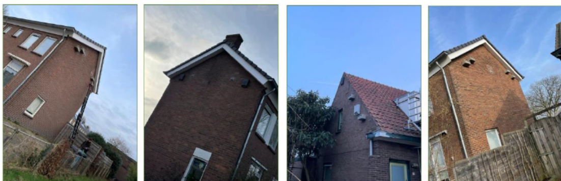
Foto's 1-4: enkele foto's van tijdelijke mitigatie kasten uit 2020 en recent aangebrachte kasten.