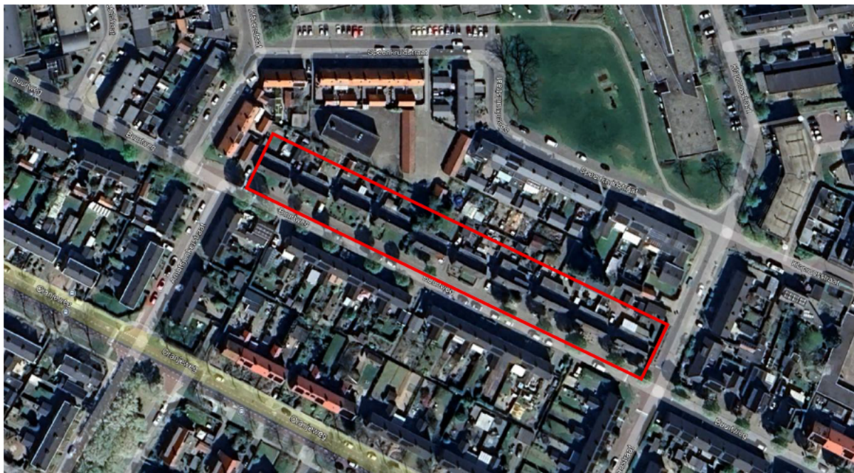
Figuur 2: Ligging van de woningen aan de Buurtweg (rode kader).

Beantwoording vragen Provincie Gelderland – Rheden – 2025-013994