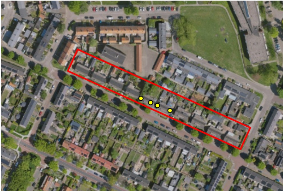
Figuur 4: Locaties van de permanente voorzieningen voor vleermuizen. Het plangebied is zwart omlijnd. De vleermuiskasten (type type VLKI13) zijn aangegeven met een gele stip.