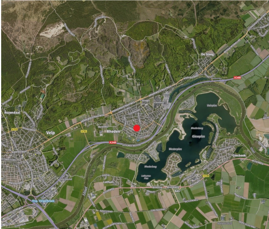
Figuur 1: Globale ligging van het plangebied. De locatie van het plangebied is aangegeven met een rode stip.