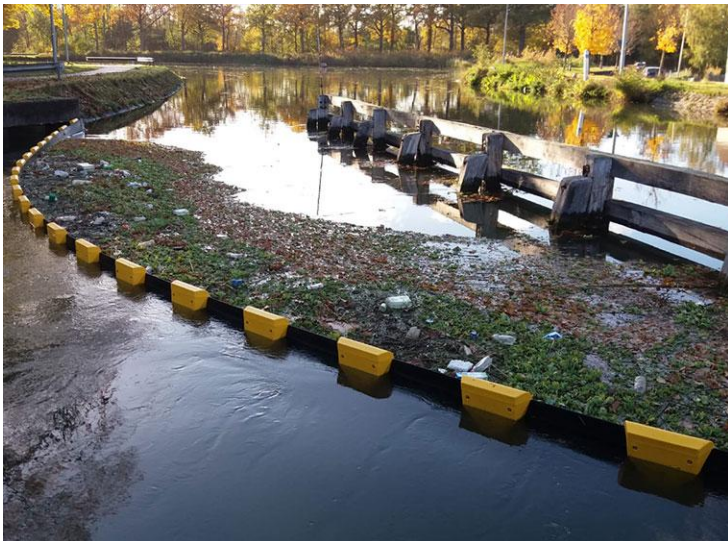
Referentiebeeld bolina booms