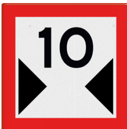
C.5 Beperkte breedte van doorvaart of vaarwater (getal tussen de zwarte peilen moet de minimale doorvaarbreedte zijn)