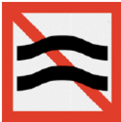
A.9 Verboden hinderlijke waterbewegingen te veroorzaken