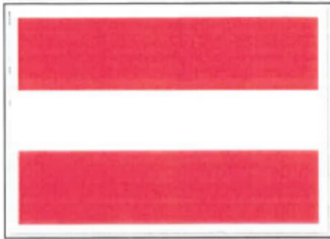
In-, uit- of doorvaart verboden (BPR, bijlage 7, A.I)

Dit bord komt op de volgende locaties te staan: