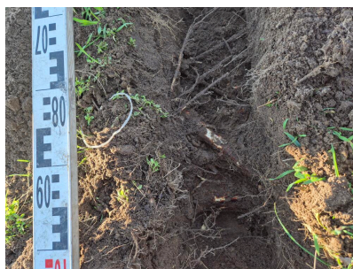
Figuur 3.5 overzicht wortelpakket