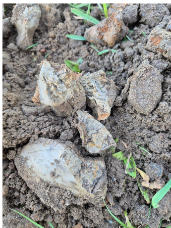
Figuur 3.2 kleilaag met blauw en rood verkleuring