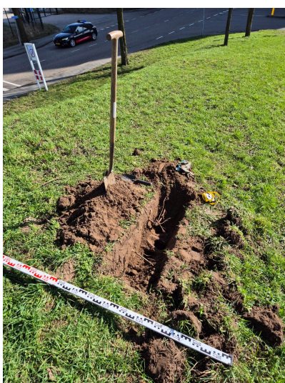
Figuur 3.10 overzicht van de proefsleuf