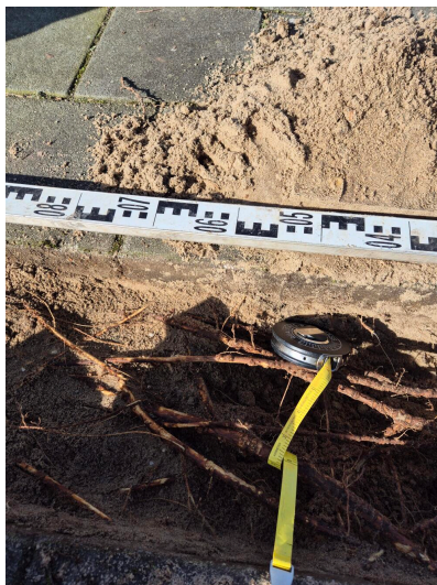
Figuur 3.8 haar- en voedingswortels