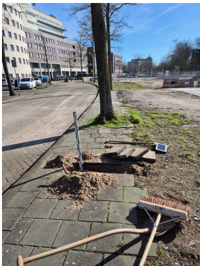
Figuur 3.7 Overzichtsfoto van situatie