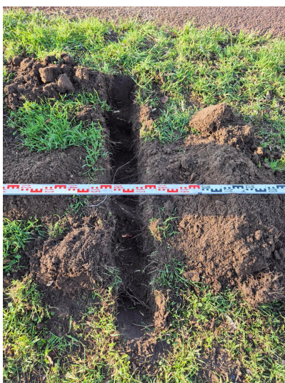
Figuur 3.4 profielsleuf 1,60 m van stamhart