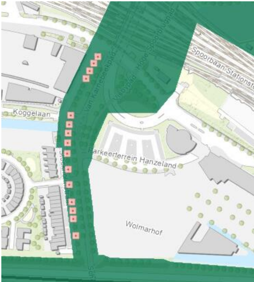
Figuur 3.13 Onderzoekgebied in relatie tot de hoofdgroenstructuur

Er wordt gebruik gemaakt van 'groenstructuren'. Hierin zijn de bomen kapvergunningsplichtig en zijn er voorwaarden verbonden aan het vellen van deze bomen. Op de Groenkaart van gemeente Zwolle is te zien dat het gebied deels binnen de hoofdgroenstructuur vallen.