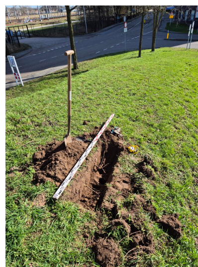
Figuur 3.12 overzicht van wortelpakket