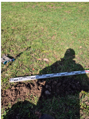
Figuur 3.1 profielboring