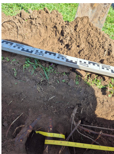
Figuur 3.11 afmetingen van de wortels