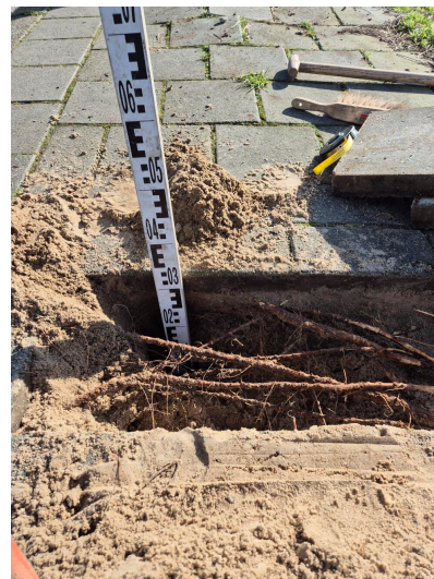
Figuur 3.9 Beworteling tot 30 cm diepte