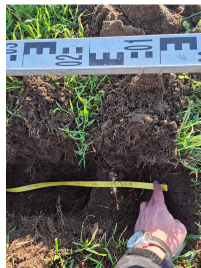
Figuur 3.6 gestelwortel doorsnee tot 10cm