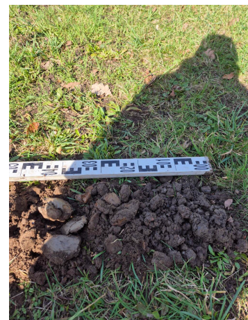
Figuur 3.3 grofzand met kleinspoeling