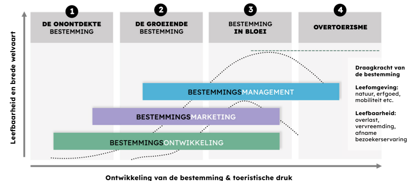
Figuur 1: Model waardevolle recreatie en toerisme (Bureau voor Ruimte en Vrije Tijd)