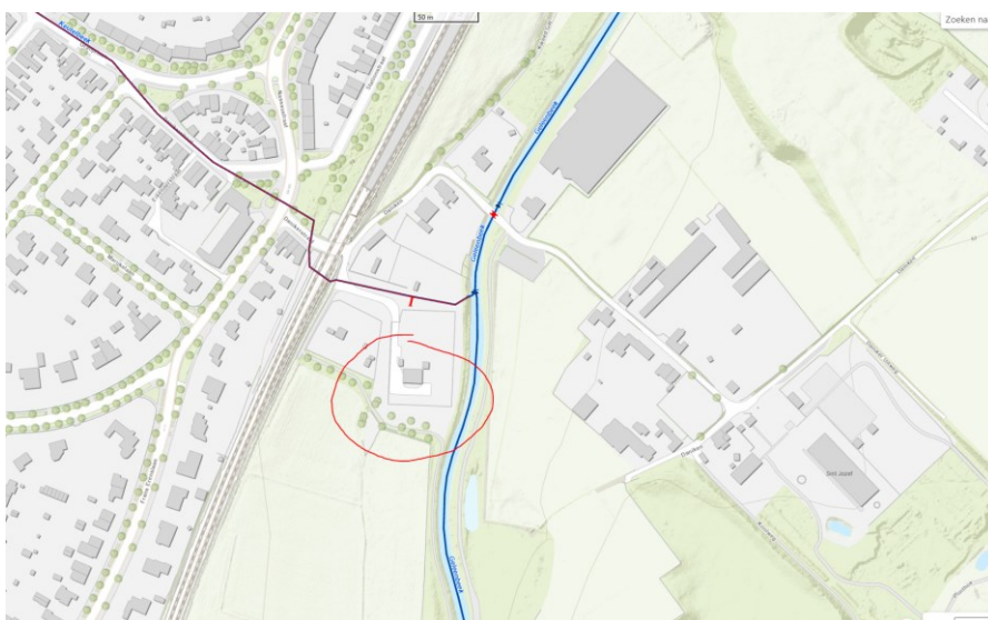
Figuur 1: overzicht van de locatie

Het onttrekken van grondwater vindt plaats op of nabij de locatie RD-coördinaten X = 186971, Y = 330607. De bronneringslocatie is gelegen buiten de boringsvrije zone Roerdalslenk en Venloschol en buiten de bufferzones grondwaterafhankelijke natuurgebieden.