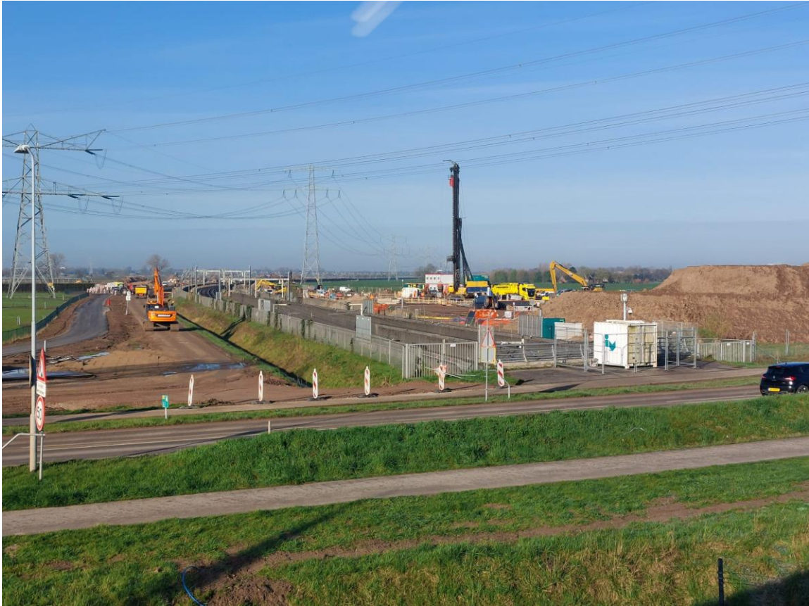
Afbeelding 1 Situatie bouwweg 't Veld 27 maart 2026