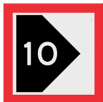
C.5 Het vaarwater bevindt zich op enige afstand van de oever (getal in zwarte vlak moet breedte van de versmalling zijn)