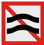
A.9 Verboten hinderlijke waterbewegingen te veroorzaken