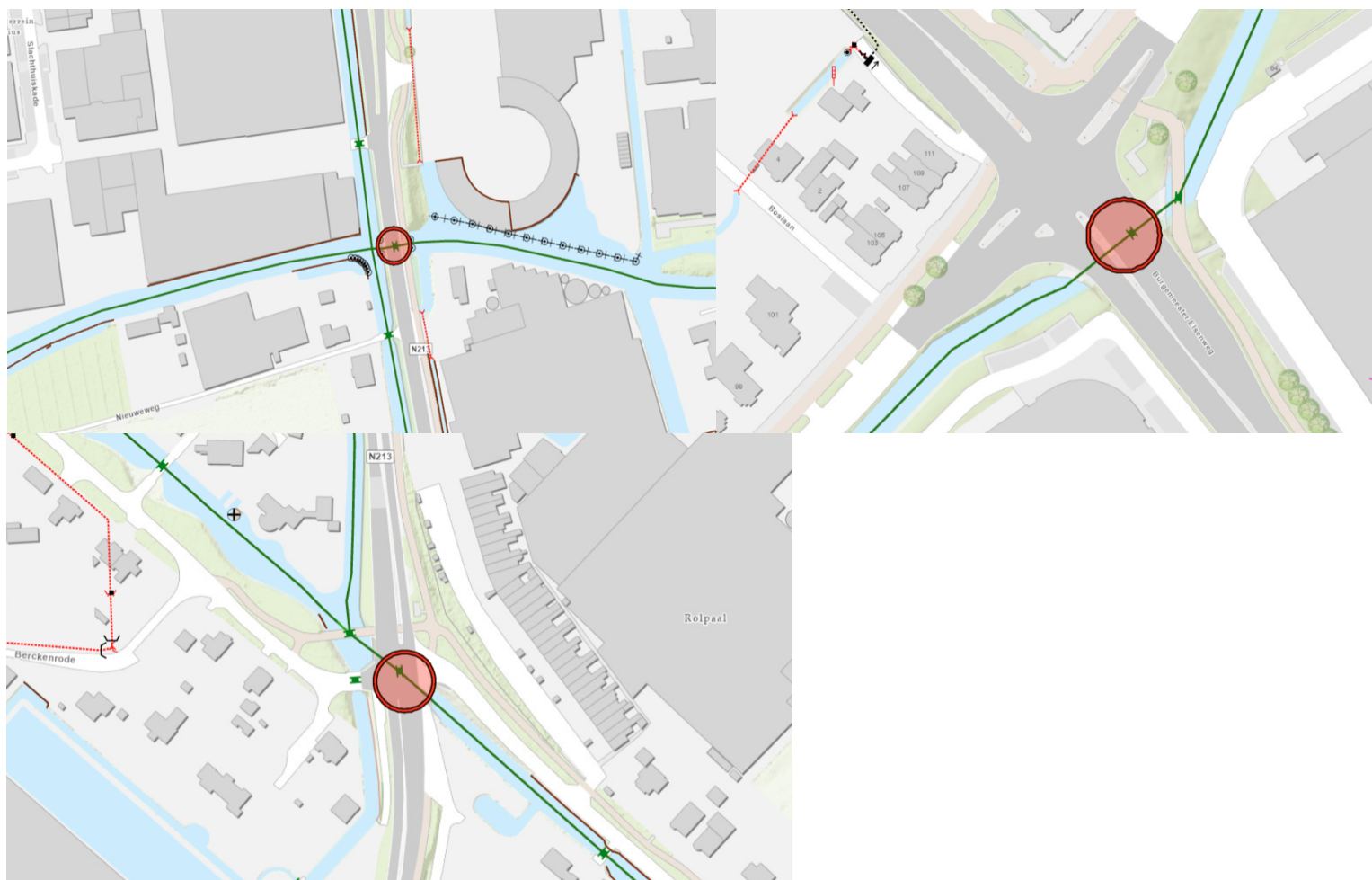
Figuur 1: Locatie gedeeltelijke stremming (rode cirkels)

Deze melding is ingediend op basis van het bepaalde in artikel 7 van de Vaarverordening Delfland voor de watergang "Nieuwe Vaart, de Gantel en de Strijp".