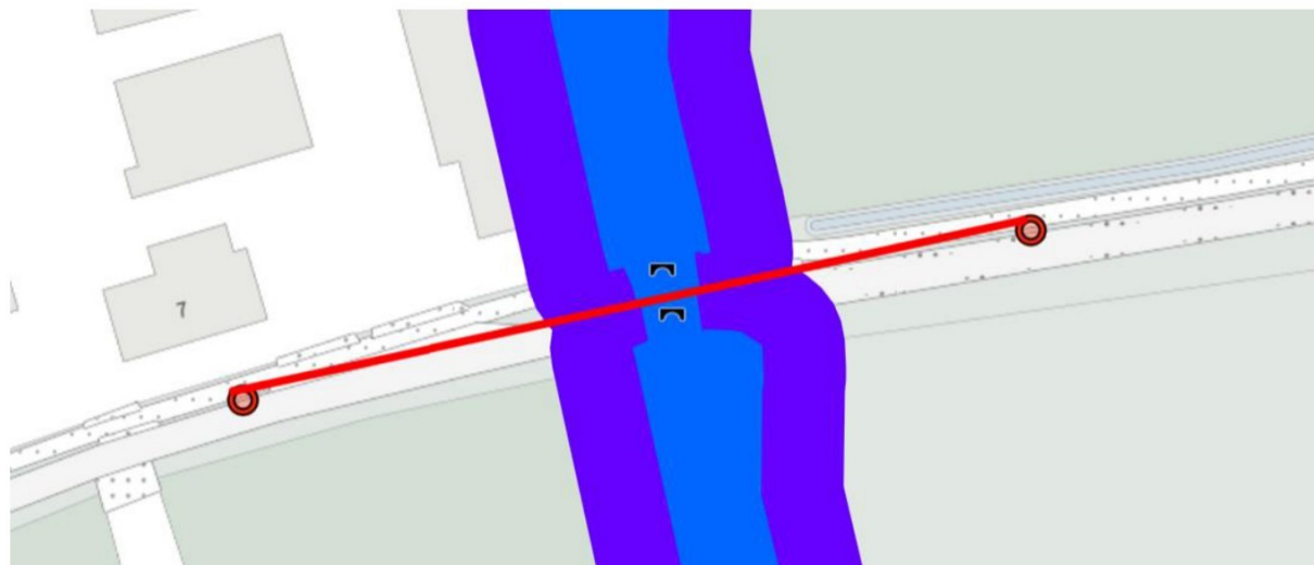
Boring nabij Loonse Baan 7 te Helvoirt