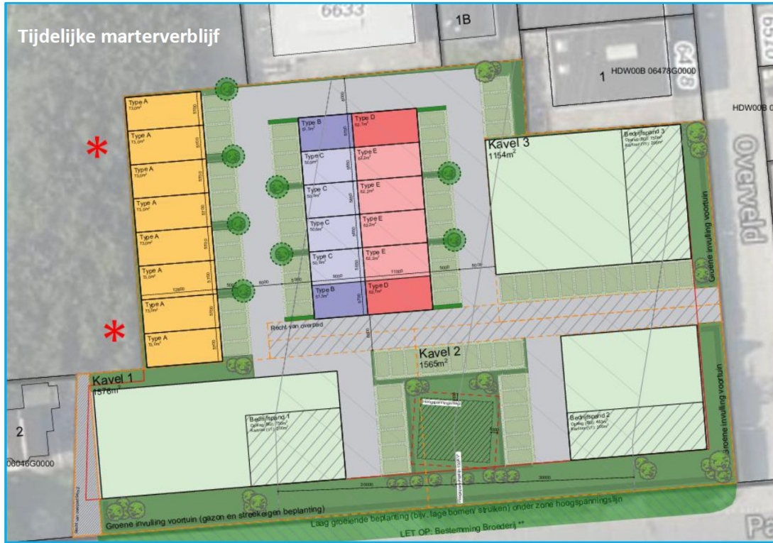
Figuur 3: Kaart van het plangebied met de locaties van de tijdelijke marterkasten van type ZK MA 01 van Vivarapro (rode sterren).