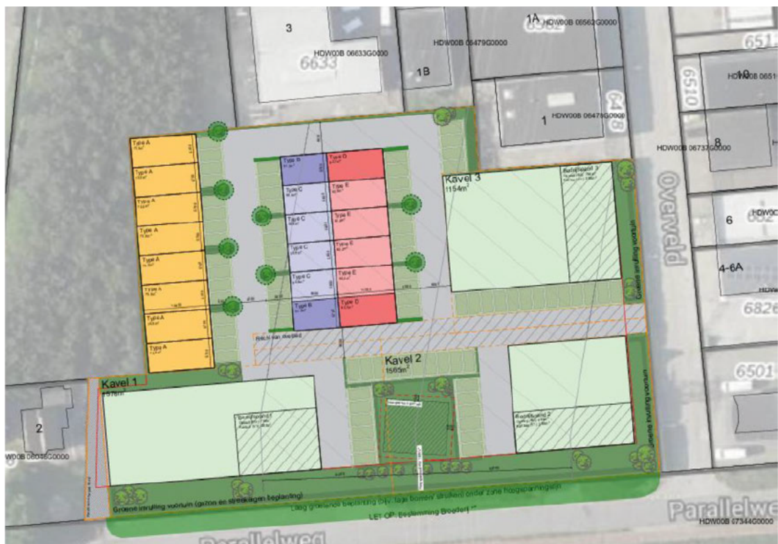
Figuur 2: Kaart van het plangebied na de werkzaamheden.