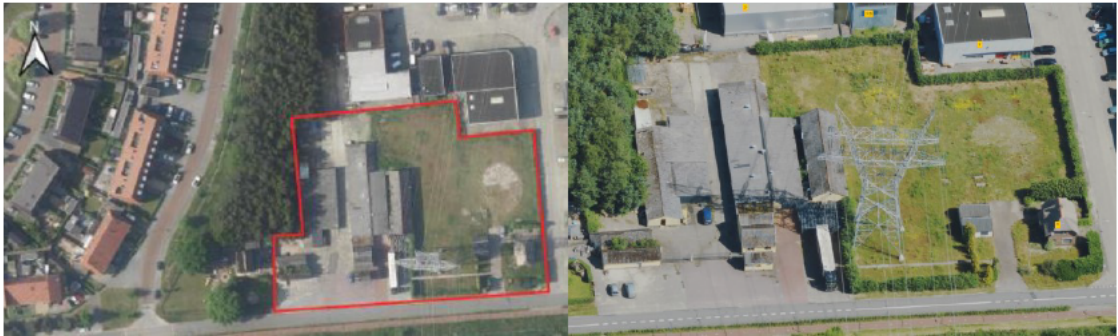
Figuur 1: Luchtfoto's van het plangebied aan Parallelweg 3 te Harderwijk (links rood omlind) en omgeving. De detailfoto rechts geeft een beeld van de aanwezige groenstructuren binnen het plangebied.