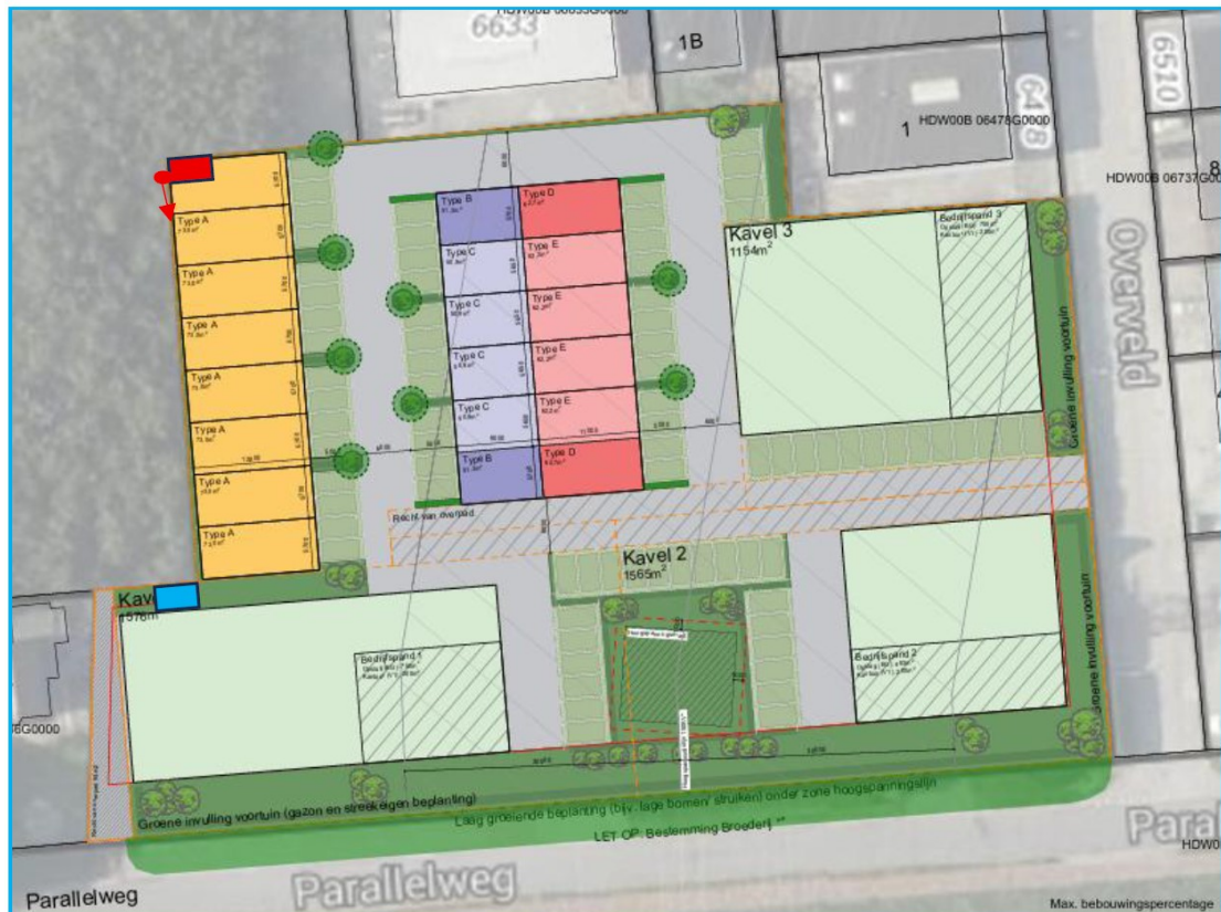
Figuur 4: Kaart van het plangebied en de locaties van de permanente mitigatie voor de steenmarter. De marterkast (type ZK MA 01 van Vivarapro) is aangegeven met het blauwe rechthoek en het rode rechthoek geeft een maatwerkvoorziening aan (zie bijlage 3, afbeelding 5).