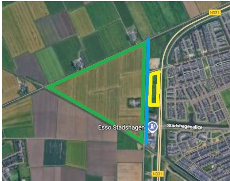
Plangebied Breecamp-West (groen), plangebied voorzieningen (geel) en verbreding Scholtensteeg (blauw)

Breecamp-West te liggen, met ruimte voor ongeveer 650 woningen. De woningbouw in Breecamp-West is weer een stap dichterbij, nu het ontwerp-omgevingsplan afgelopen december door het college van B en W is vastgesteld. Daarnaast is op een voorzieningenkavel aan de Scholtensteeg onder meer plek voor de bouw van een school, de Eliëzer- en Obadjaschool. Deze ontwikkelingen hebben invloed op de verkeerssituatie en zorgen onder meer voor extra verkeer ter plekke.