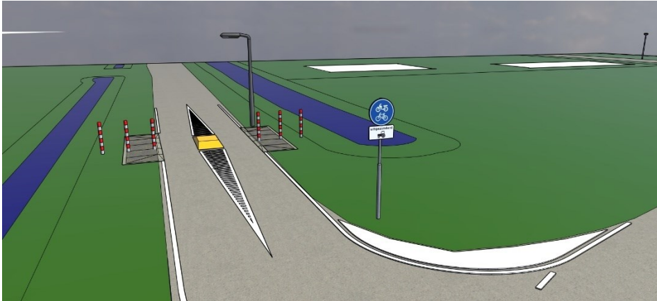
Impressie van een landbouwsloop

De planning van bovengenoemde toekomstige aanpassingen is op dit moment nog niet bekend.