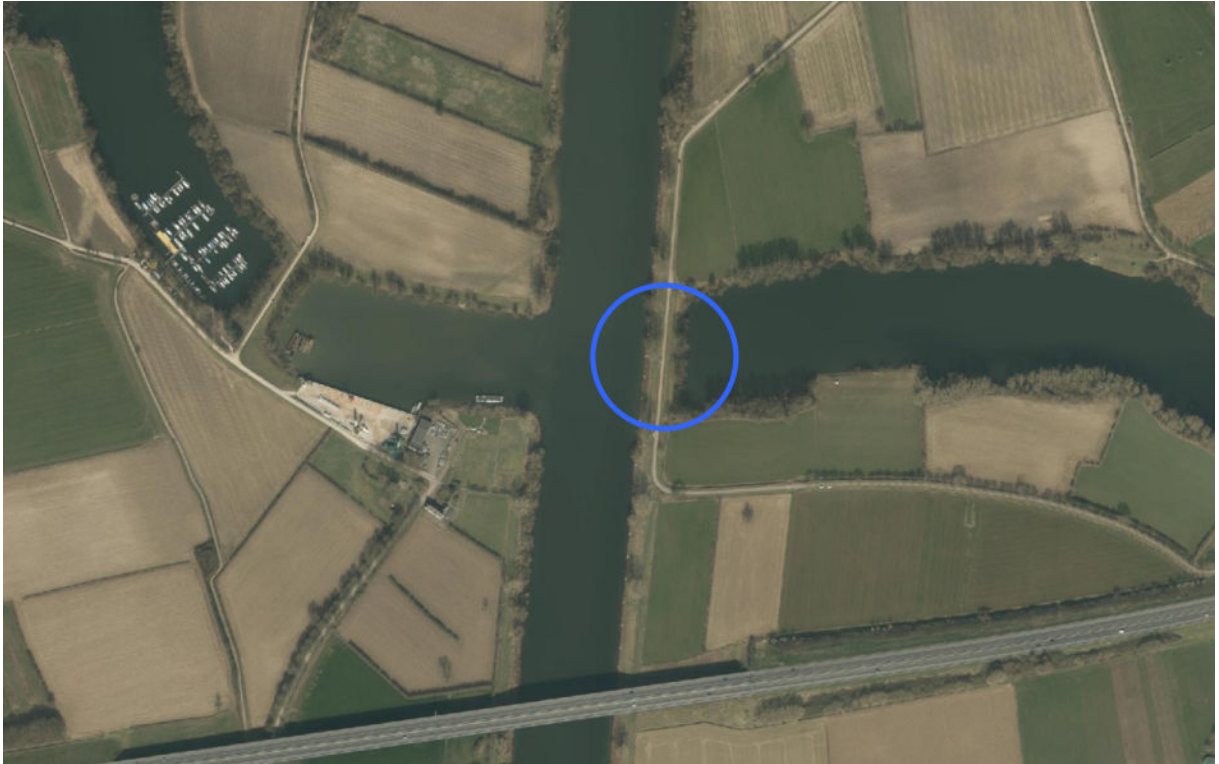
Figuur 1: overzicht van de locatie

Het onttrekken van grondwater vindt plaats op of nabij de locatie RD-coördinaten X = 194991, Y = 408918.