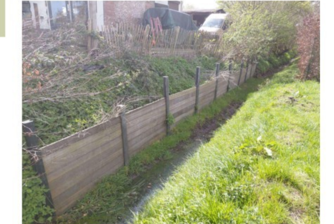
Het talud met de sloot inclusief de bestaande damwand. Aan de linkerzijde is de bestaande damwand te zien op het kavel van de Stoodijk 23 te Steenberg. Aan de rechterzijde is het talud te zien van de achterburen.