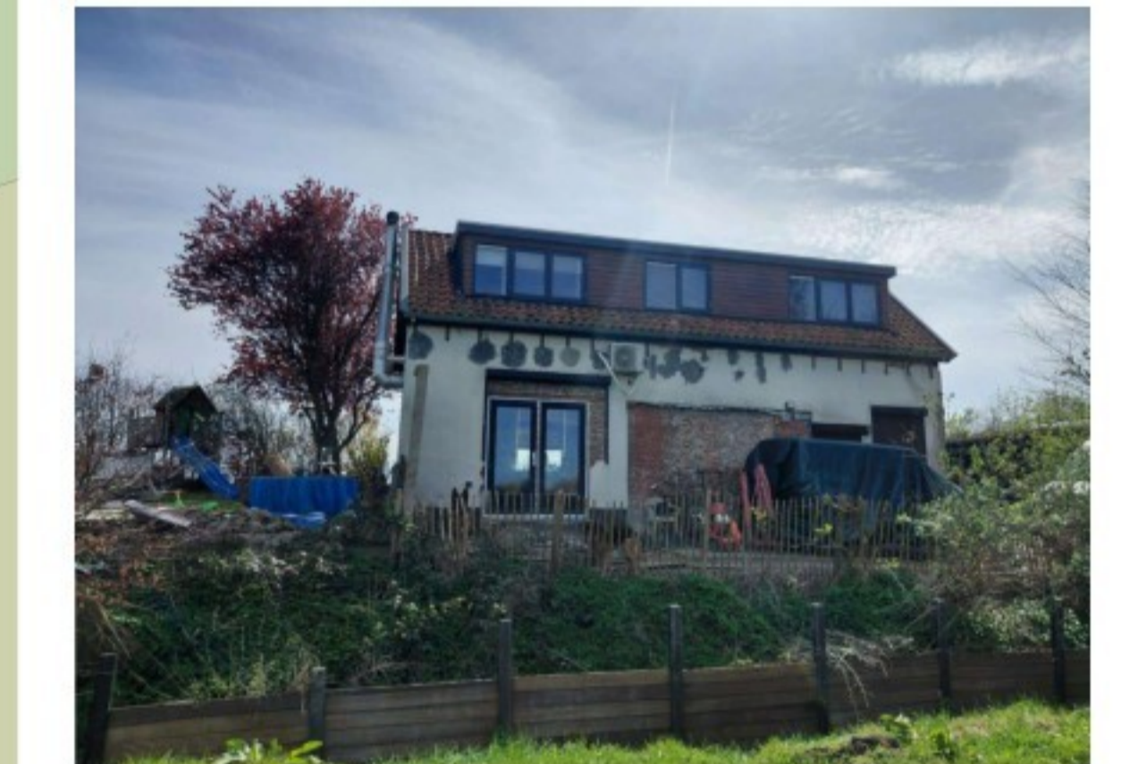
De achtergevel van de woning aan de Stoodijk 23 te Steenberg. Hierin is het talud te zien inclusief de bestaande damwand.