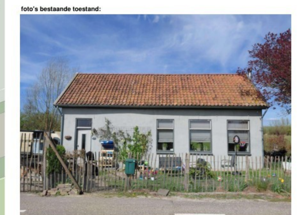
De voorgevel van de woning aan de Stoodijk 23 te Steenberg