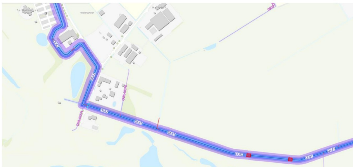
Figuur 2: Locatie aanduiding van de te verwijderen dammen met duikers ten zuidoosten van Heiderschoor 26 in Mierlo