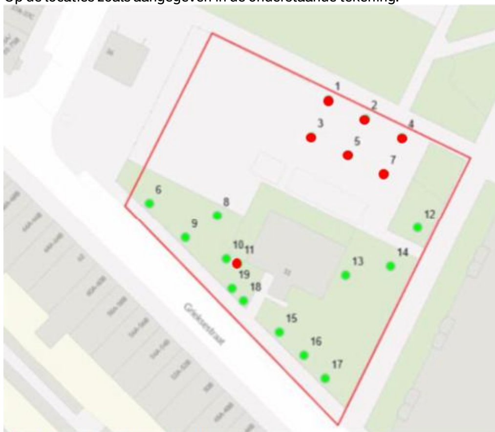
Afbeelding 2 in rood de te rooien bomen

Op de locaties zoals aangegeven in de onderstaande tekening.