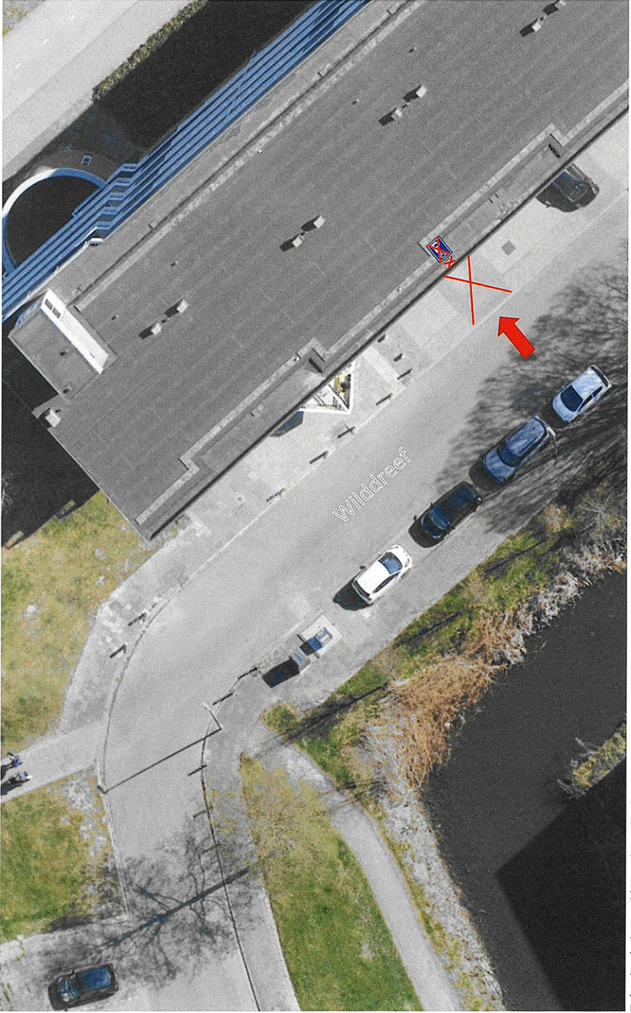
Tekening behorend bij verkeersbesluit opheffen gereserveerde gehandicaptenparkeerplaats aan de Widdreef, Z/26/194359/453184